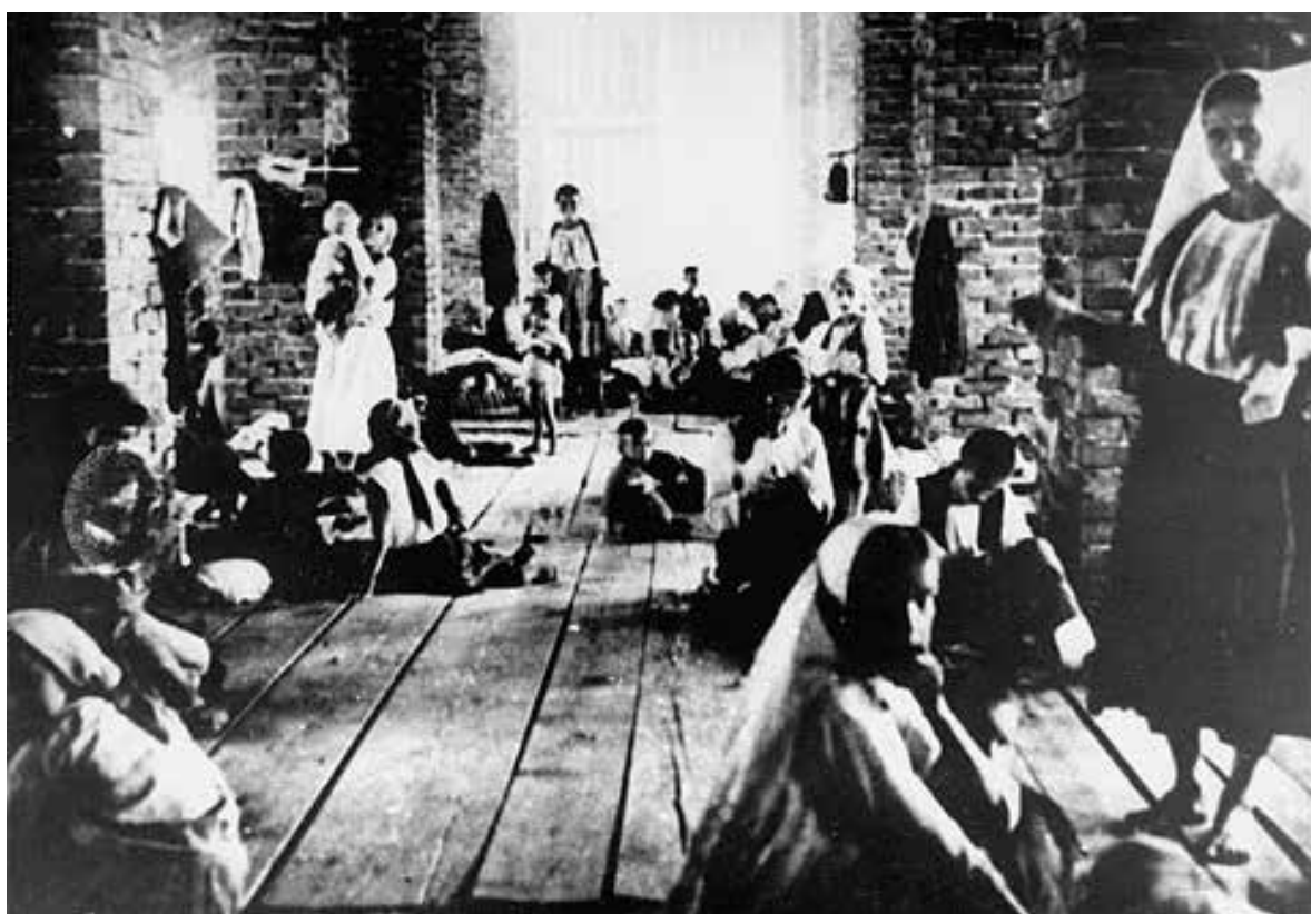
ДЈЕЦА СА МАЈКАМА У ЗЛОГЛАСНОЈ КУЛИ У ЛОГОРУ СТАРА ГРАДИШКА