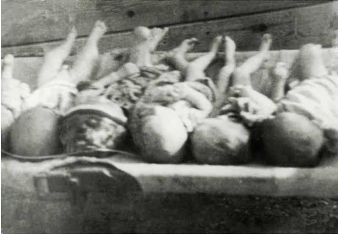
КОЗАРСКА ДЈЕЦА У ЛОГОРУ ЈАСЕНОВАЦ