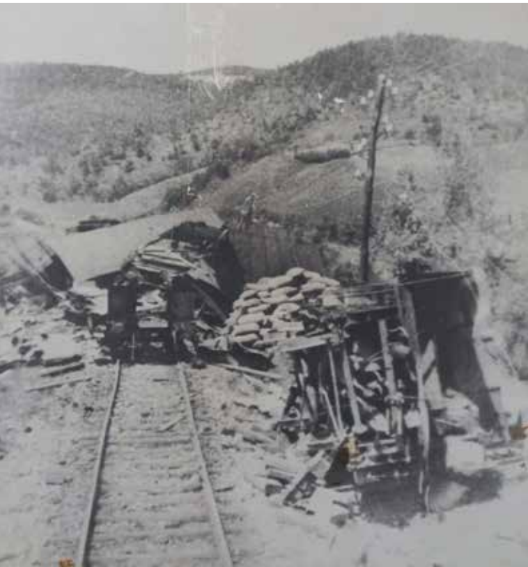
ДИВЕРЗИЈЕ УСТАНИКА НА ПРУЗИ ПРЕМА Г. ПОДГРАДЦИМА СУ УСПОРАВАЛЕ НАПРЕДОВАЊЕ НЕПРИЈАТЕЉА