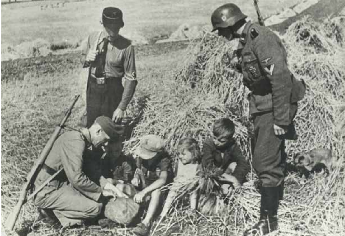
ПРЕТРЕСАЊЕ ДЈЕЦЕ НА КОЗАРИ ТОКОМ ОФАНЗИВЕ У ЉЕТО 1942. ГОДИНЕ