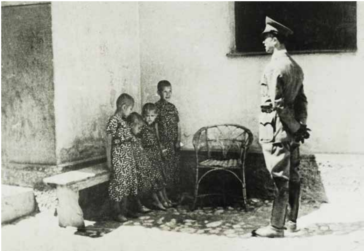
НА САСЛУШАЊУ У САМОСТАНУ СВ. ВИНКА ПАУЛСКОГ У ЈАСТРЕБАРСКОМ