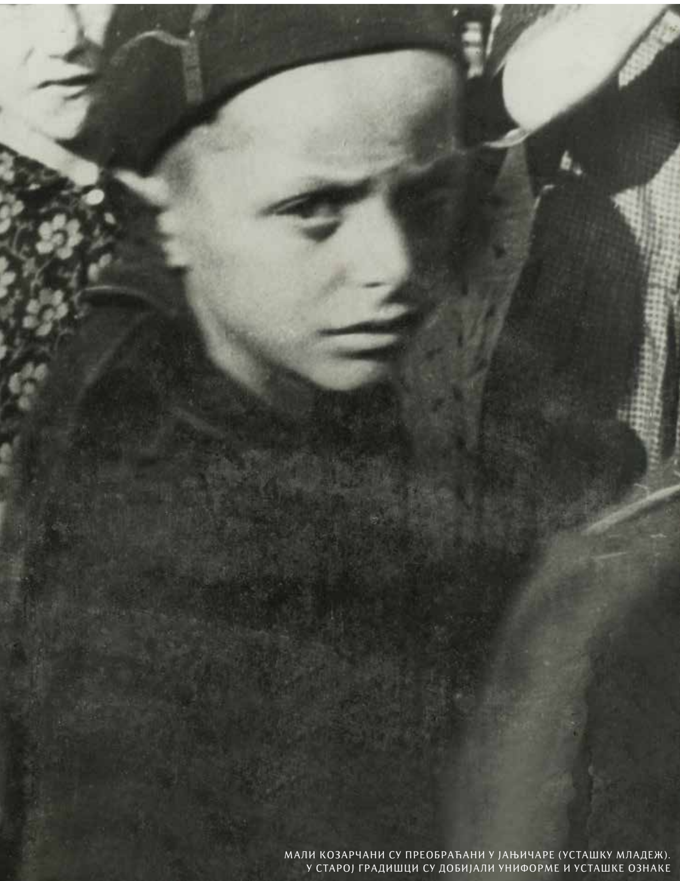
МАЛИ КОЗАРЧАНИ СУ ПРЕОБРАЋАНИ У ЈАЊИЧАРЕ (УСТАШКУ МЛАДЕЖ). У СТАРОЈ ГРАДИШЦИ СУ ДОБИЈАЛИ УНИФОРМЕ И УСТАШКЕ ОЗНАКЕ