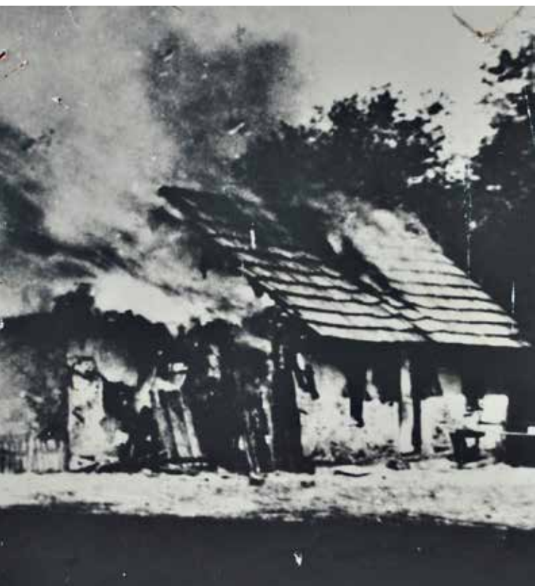
КОЗАРА У ПЛАМЕНУ

БОСАНСКА ГРАДИШКА, 22. АПРИЛА 1941. ГОДИНЕ