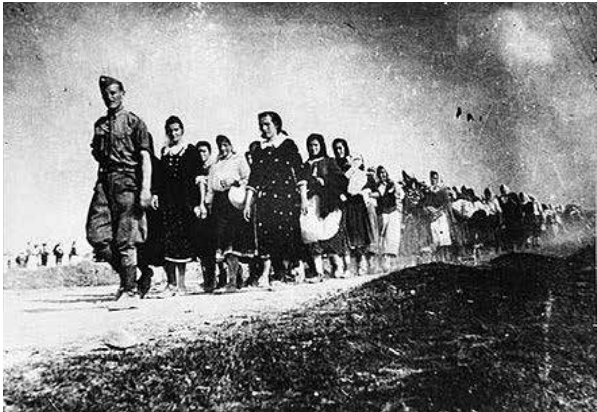
СПРОВОЂЕЊЕ НАРОДА СА КОЗАРЕ У ЛОГОРЕ

P R O G L A S ***** 1. Njemačke i Hrvatske čete na operacionom području zapadne Bosne stoje pod mojom zapovjedi. U ovim je krajevima izvršena vlast prešla u moje ruke. Od strane vlade podupire me gosp. veliki župan Dr. Petar Gvozdić iz Banje Luke, općinski ministar unutarnjih poslova. 2. Svima onima, koji državu Hrvatsku iskreno priznaju, hrvatska vlada jamči jednakopravnost pred zakonom bez razlike vjersko-povjedi ili načelnosti, a isto tako i zaštitu života i imenka. Ona traži samo vjernost i iskrenu privrženost novoj državi Hrvatskoj. Poziva sve mirne građane na suradnju sa hrvatskim vlastima. Podneto će se potrebne mjere za ponovnu izgradnju oštećenih dobara. 3. POSLJEDNJI PUT POZIVAM SVE LOJALNE GRAĐANE NA MIR I MİR. 4. Oružje i streljivo se izade predati dolazećim savezničkim četama. 5. Ako pred četama bjeli smatrat će se sumnjivim. Na njega će se poesti. 6. Čete će se boriti samo tamo, gdje nailaze na otpor, a svaki će otpor skititi. 7. Nedovoljeno držanje oružja, podspiranje pobunjenika i njihovih pomagača kaznit će se smrću. 8. Pobjedonosne borbe Njemačke vojske i njezinih saveznika u dubokoj Rusiji se nastavljaju. Stolac, dne 5. VI. 1942. Njemačko zapovjedništvo u operacionom području STALH v.r., general - major. Da je priopće suglasan sa izvornikom potvrđuje Tajnik Velikog župana [Signature]