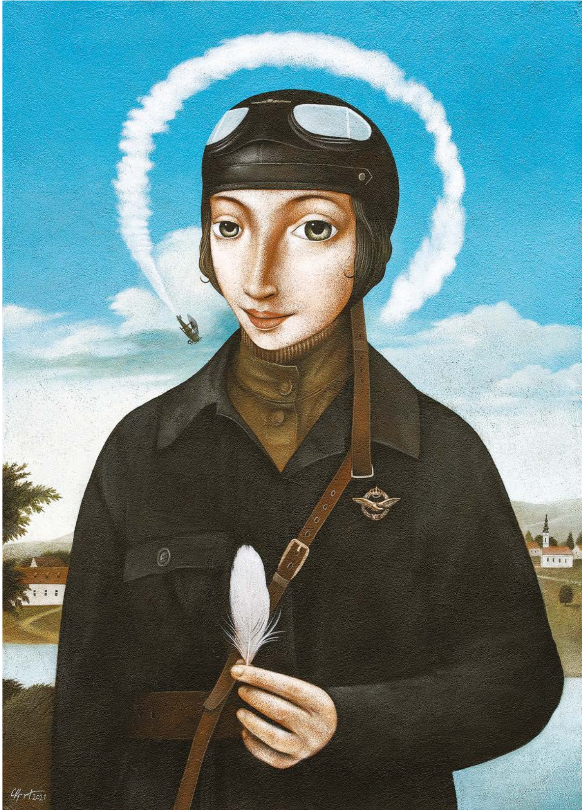
БОГИЊА ЛУПИНГА (СЕЋАЊЕ НА ДАНИЦУ ТОМИЋ, ПРВУ СРПСКУ АВИЈАТИЧАРКУ), 2021.