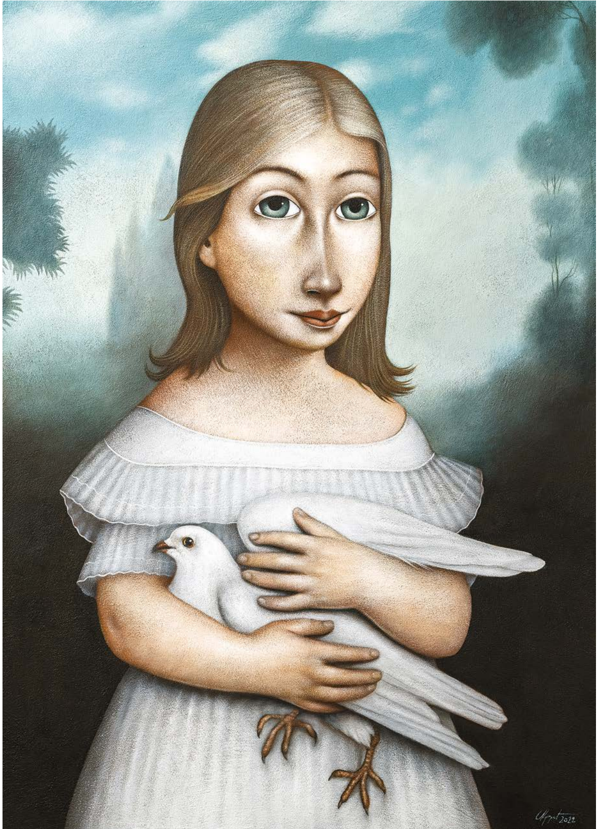
ПАТРОН КАБАРЕА, 2022.