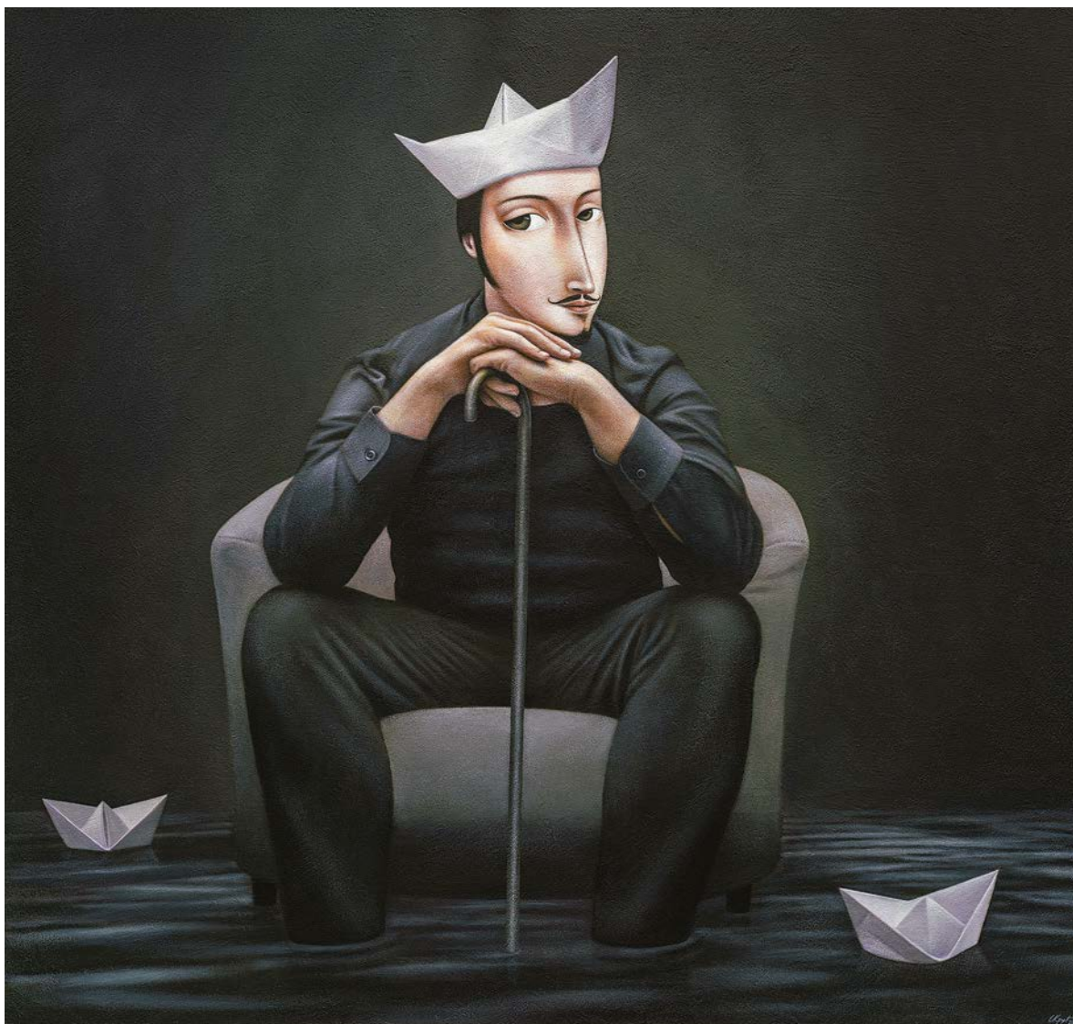
ТРЕЋИ КРАЉ, 2024.

Ваш сусрет представља тајни договор и предосећање да је куцнуо час да свет мора добити нову димензију.