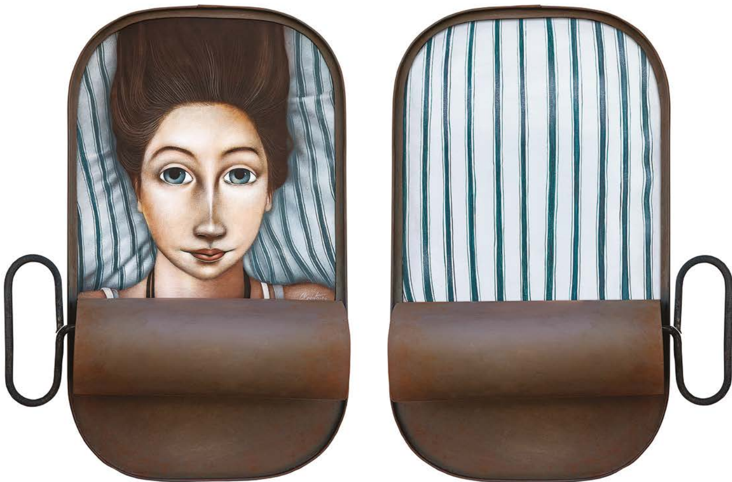
НЕСАНИЦА ЗА ДВОЈЕ (ДИПТИХ), 2022.

губила битку. Данас је дошло до тога да нико не зна како садашњу уметност да назове. Она је данас облик производње, пројекта. Уметност је изгубила везу са подсвешћу, тим тамним бунаром иза ума. Свесност и „уметност“ су сада повезани – досеткама. Епохе које су биле и прошле тражиле су спас у декаденцији.