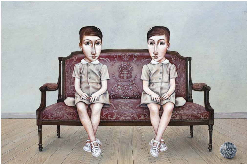
КЛОТ И ФРКЕТ , 2020.