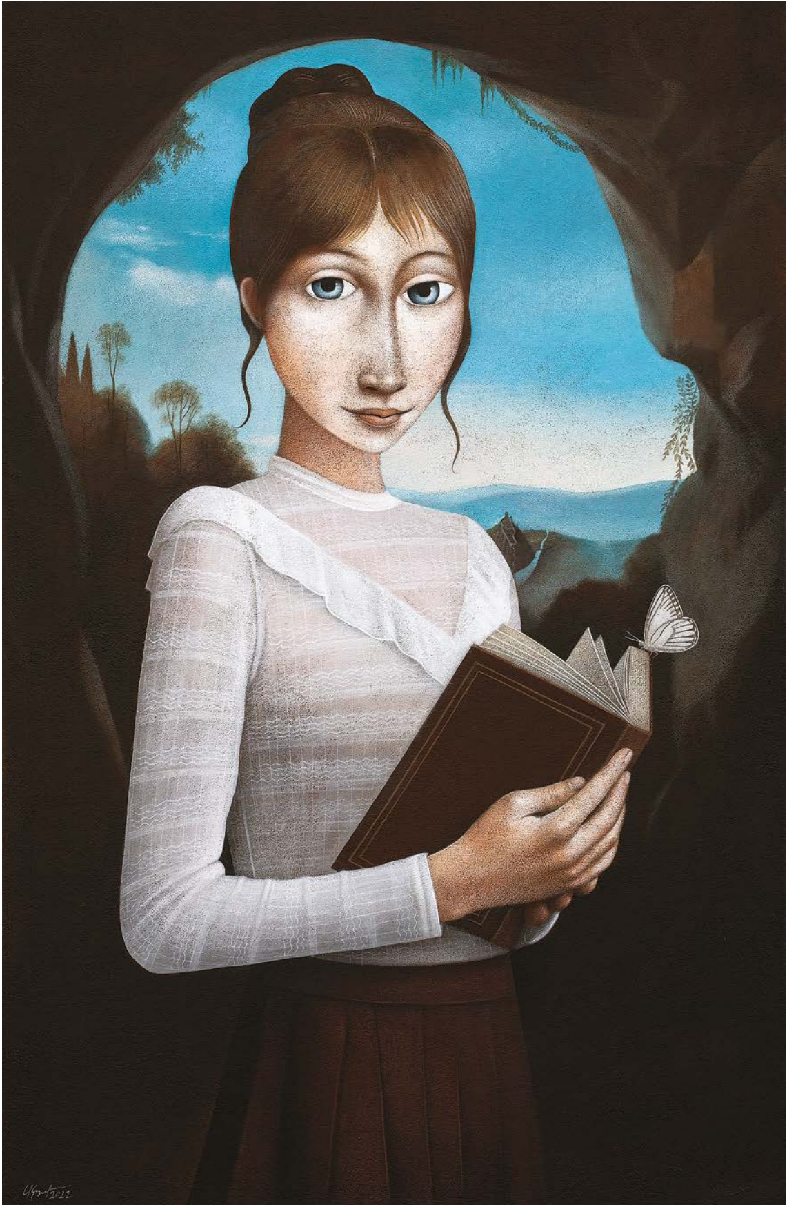
ПОСЛЕДЊА ИГРА ЛЕКТОРА, 2022.