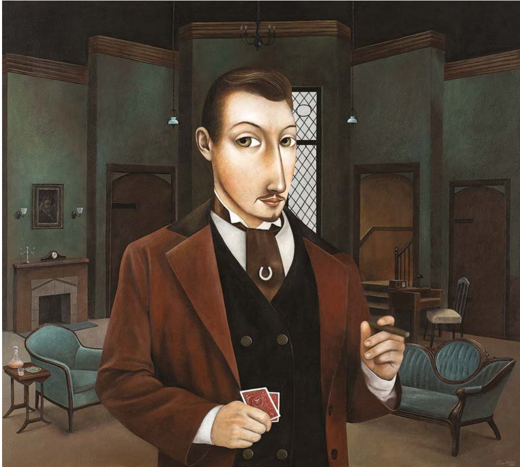
ПРЕПРЕДЕЊАК , 2021.