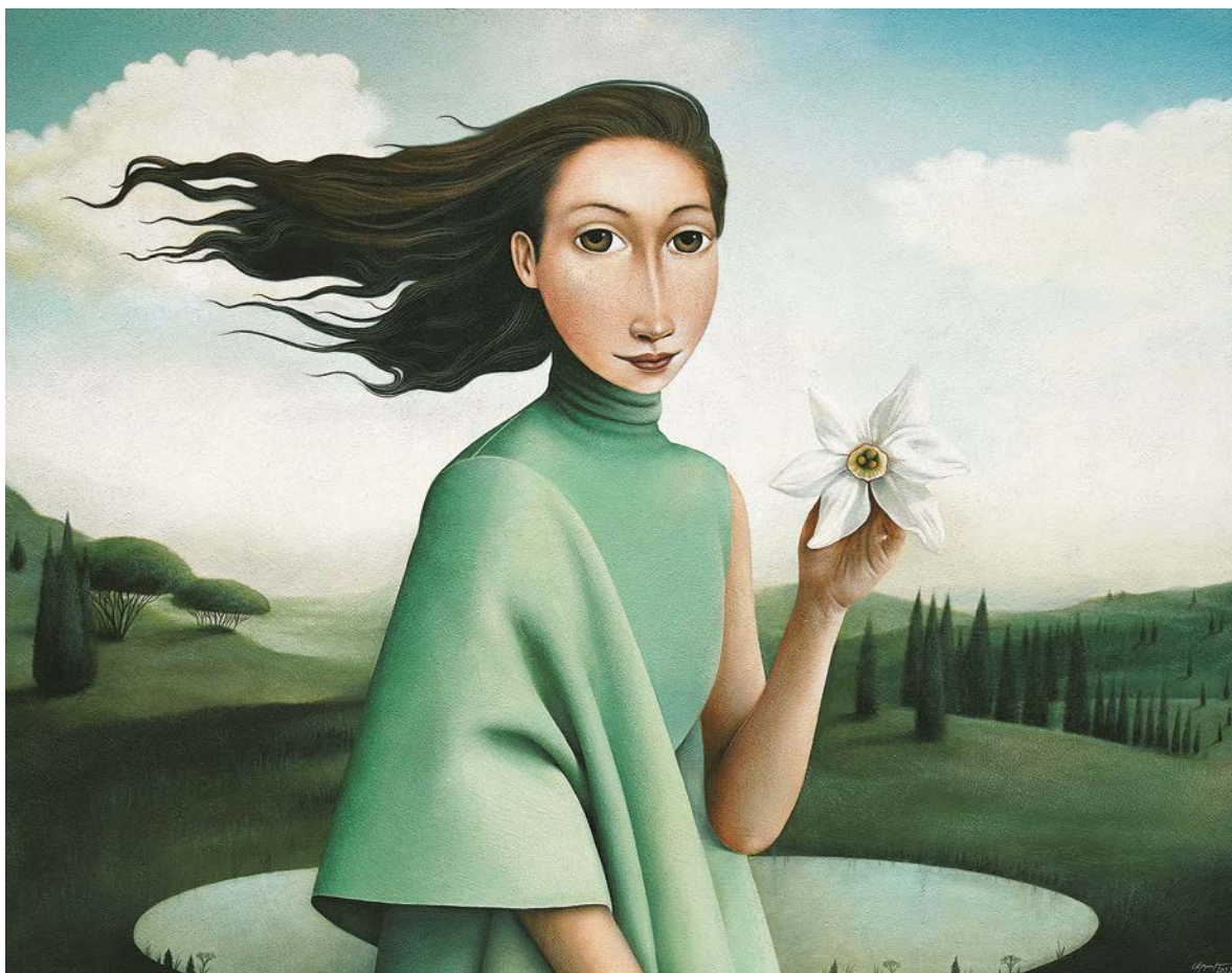
ВЕТРОЛОВКА , 2022.

декаденција. Али симболи на тим сликама могу да значе радост, тугу, меланхолију, пролазност живота, рађање новог света и нових идеја, запитаност над светом, страх, смрт или њено наслуђивање. Све је то скупљено у интуицији и наслуђивању сликара који портретише, или ти симболи значе нешто конкретно. Али то једино или слуги или зна портретиста, јер он путем своје уметности „види“ судбину, али не само судбину једне личности, него и судбину света. У том тренутку он је и „јунговац“, или „фрејдовац“, или „видовити“, дакле неприкосновени. Смисао уметности је, између осталог, и у томе.