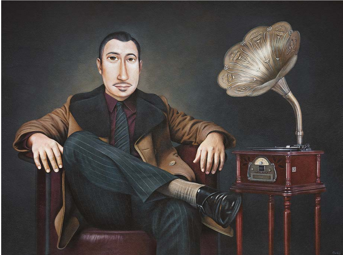
MR. T-BONE И СТАРИ ГРАМОФОН, 2023.

дакле сага и овде , парафраза је оног што само што није ту, што је увек пред вратима.