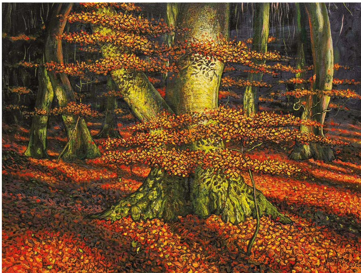
ШУМСКА ТИШИНА, 2023.

Лајтмотив поставке свакако и јесу шуме, у чијим јединственим атмосферама препознајемо везаност за архетипско. Спајањем виђеног и имажинарног, увођењем личног и магијског у приказима монументалних, чворноватих стабала, као и шума раскошног колорита, сагледавамо везу са уточиштем – оним праисконским, јер дрвеће има корење у нашим прецима. Оно је на метафизичком нивоу знамење повезивања два антипода – живота и смрти, а шуме су полазиште за интерпретацију духовног промишљања. Наглашени крошњи, њихова колоритна треперавост видљива је кроз сва четири годишња доба, специфичног приступа феномену светлости.