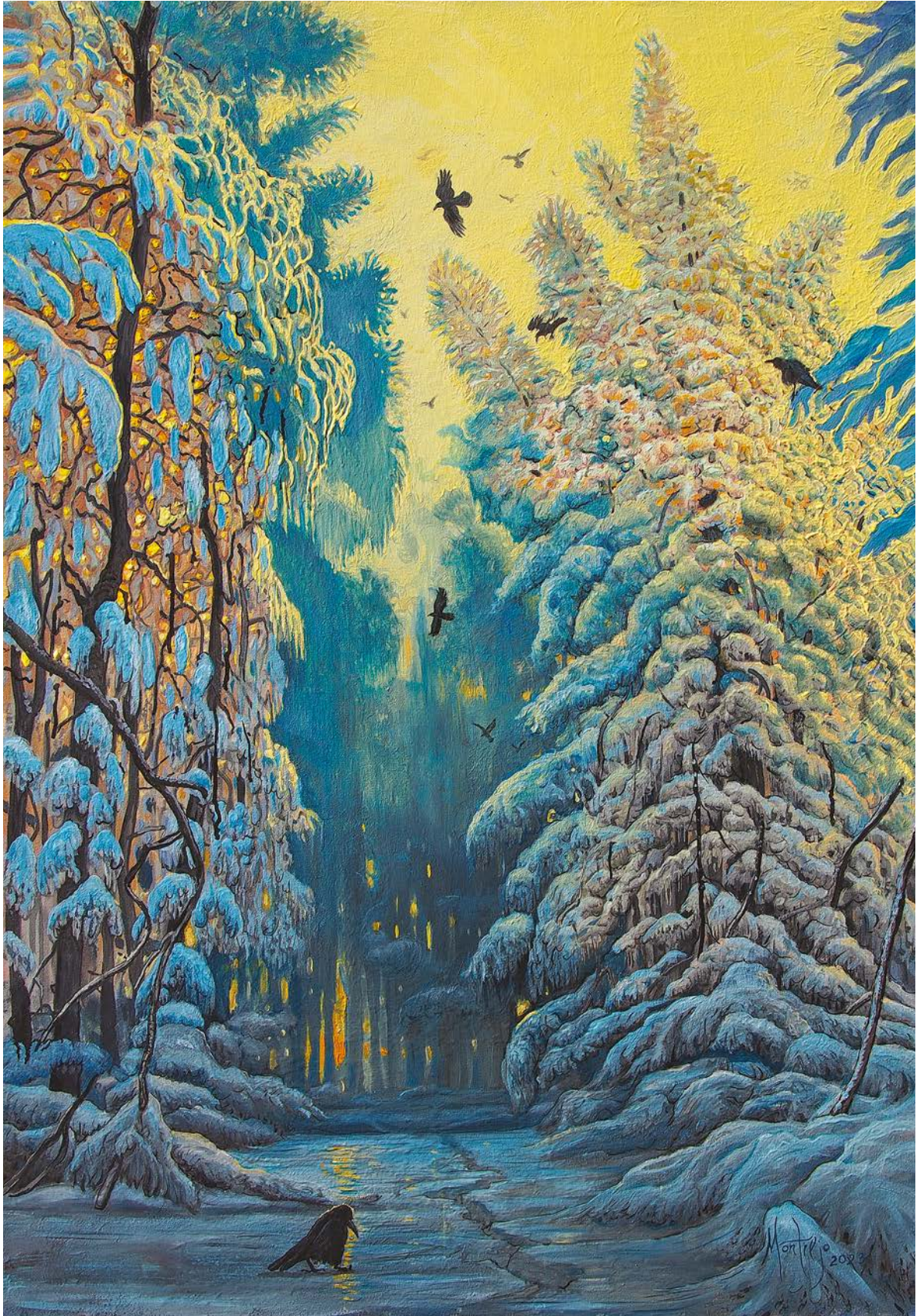
ЗИМСКА КРАТКОДНЕВНИЦА, 2023.