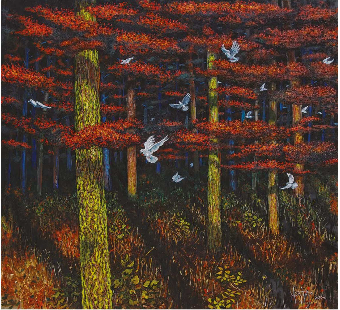
ЛЕТ У РАСТИЊУ, 2024.