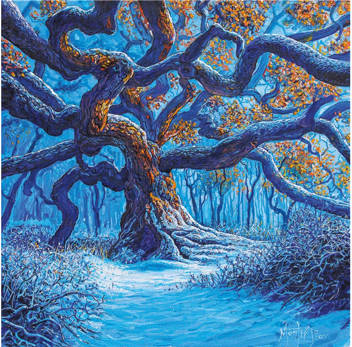
ЗИМСКО СУНЦЕ, 2024.