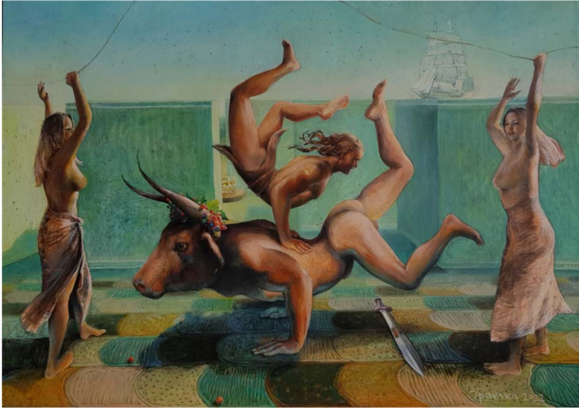
ИГРА СА МИНОТАУРОМ, 2022.