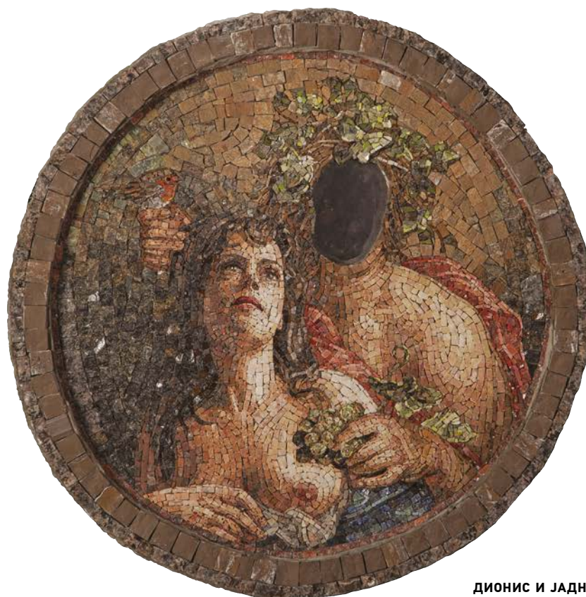
ДИОНИС И ЈАДНА АРИЈАДНА, 2018.