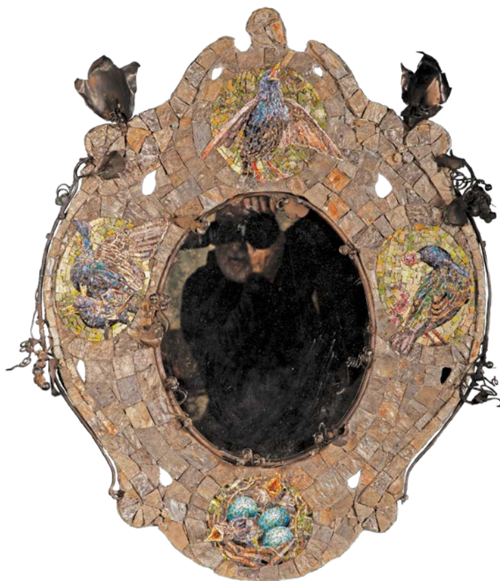
ЖИТИЈЕ ЧВОРКА, 2019.