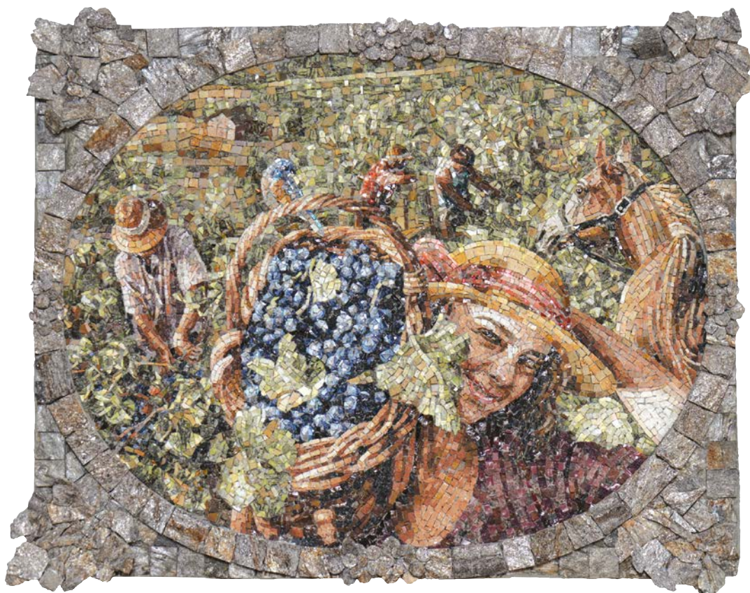
БЕРБА МЛАДОГ ГРОЖЂА У СТАРОМ ВИНОГРАДУ, 2020.