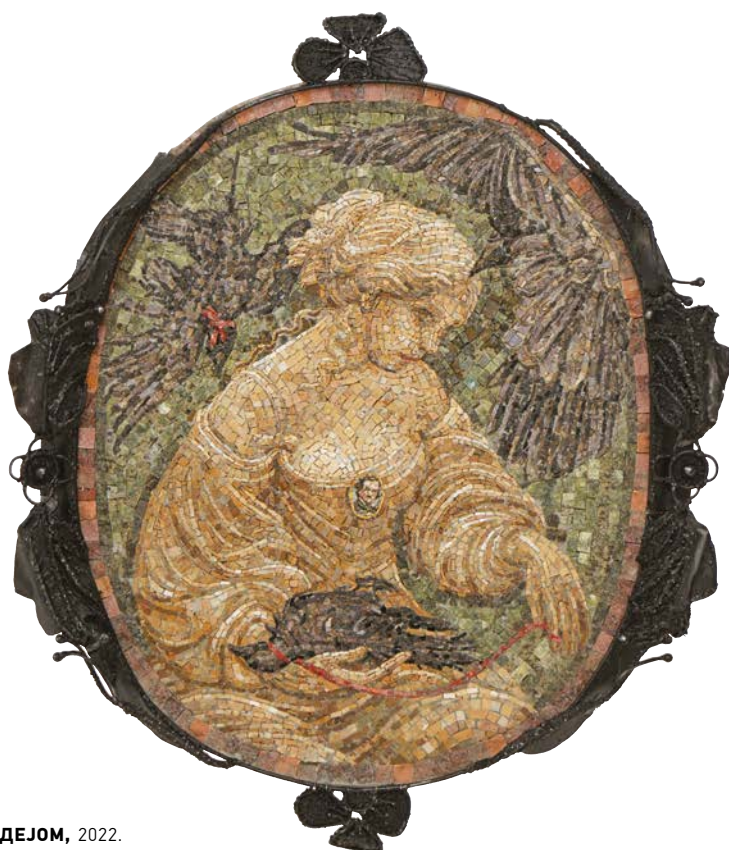
КАМЕЈА У БОРБИ СА ИДЕЈОМ, 2022.