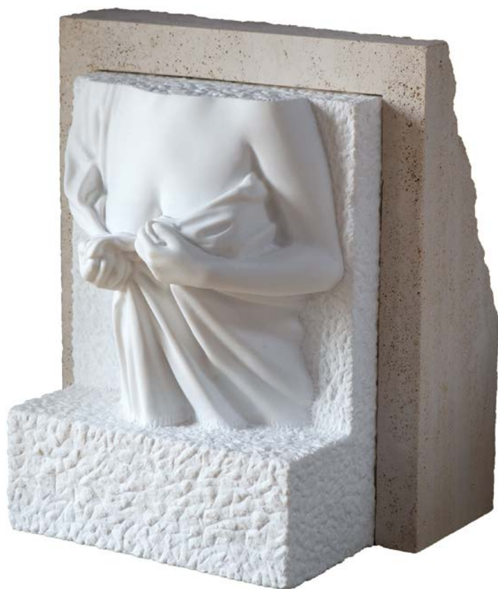
04:38 , 2021.