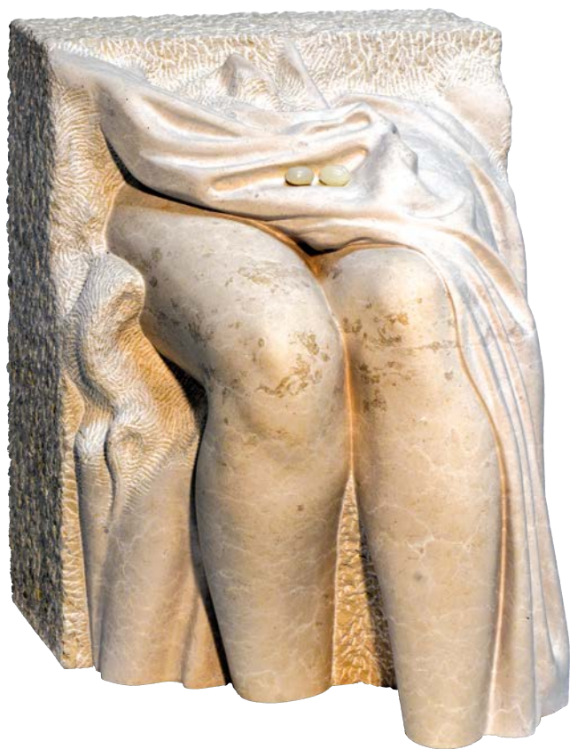
ОПЛЕНАЧКО ЈУТРО , 2021.