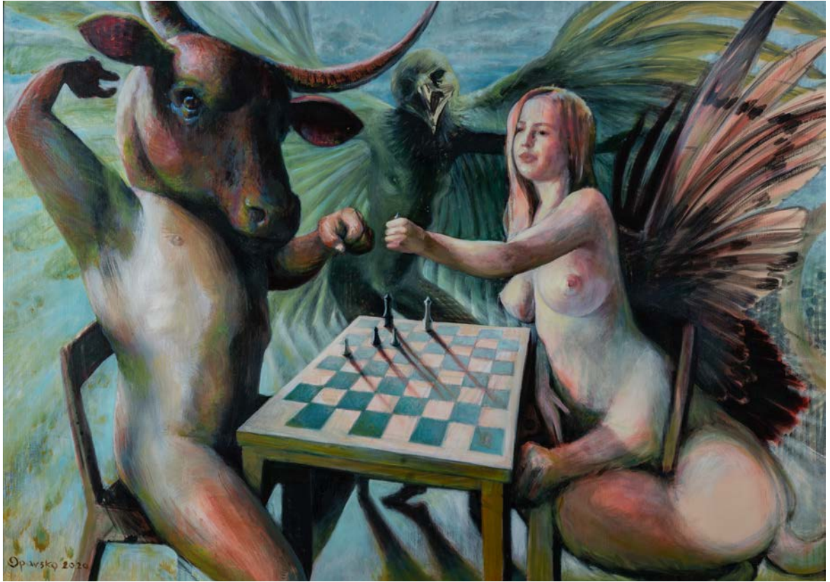
МАЈСТОРИ ИГРЕ, 2020.