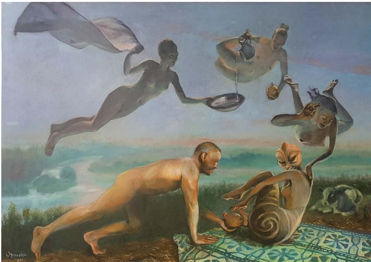
ВИНЧАНСКА МАЈКА, 2022.