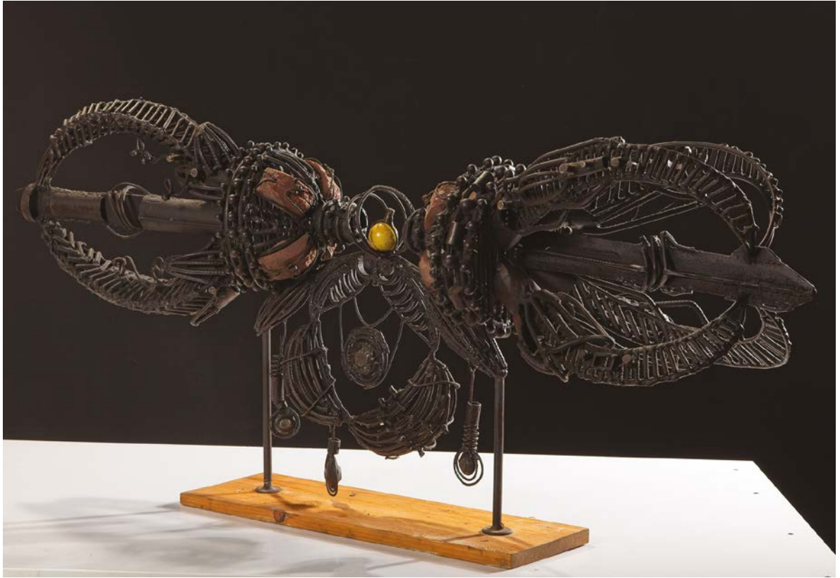
ГРОМ , 2002.