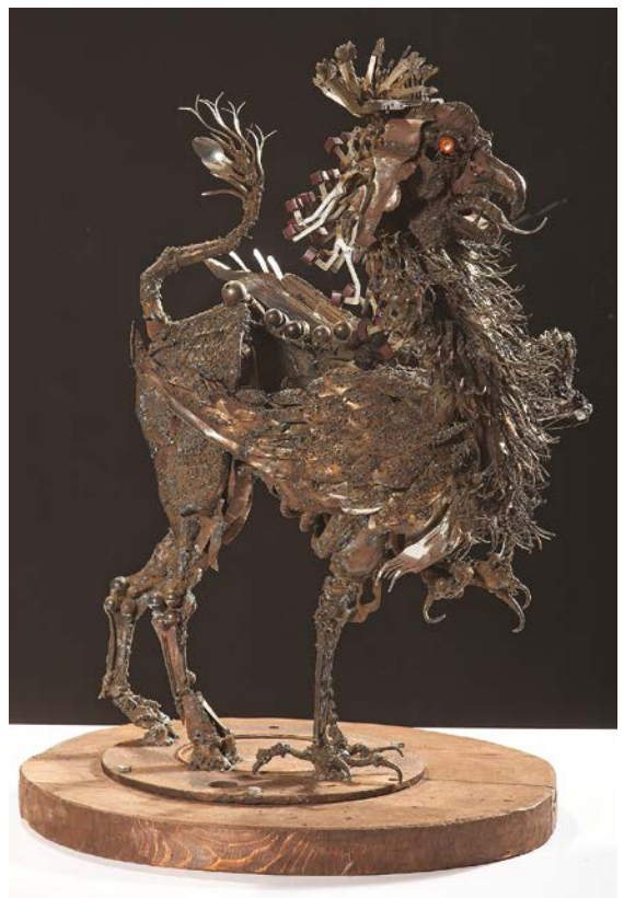
ГРИФОН , 2019.