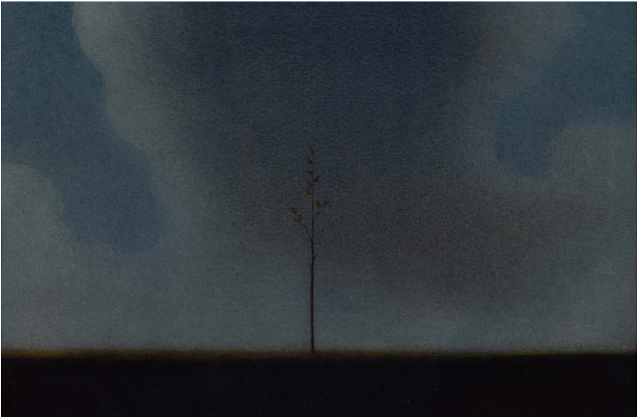
ПЕЈЗАЖ II , 1991, АКВАРЕЛ 21×31, ВЛАСНИШТВО АУТОРА