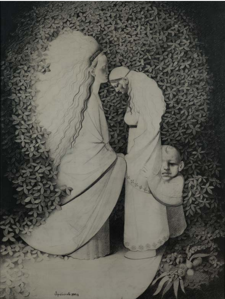
БЛАГОВЕСТИ , 2000–2005, УГЉЕН НА ПЛАТНУ 129×99,5, ВЛАШНИШТВО МОМЧИЛА МОШЕ ТОДОРОВИЧА