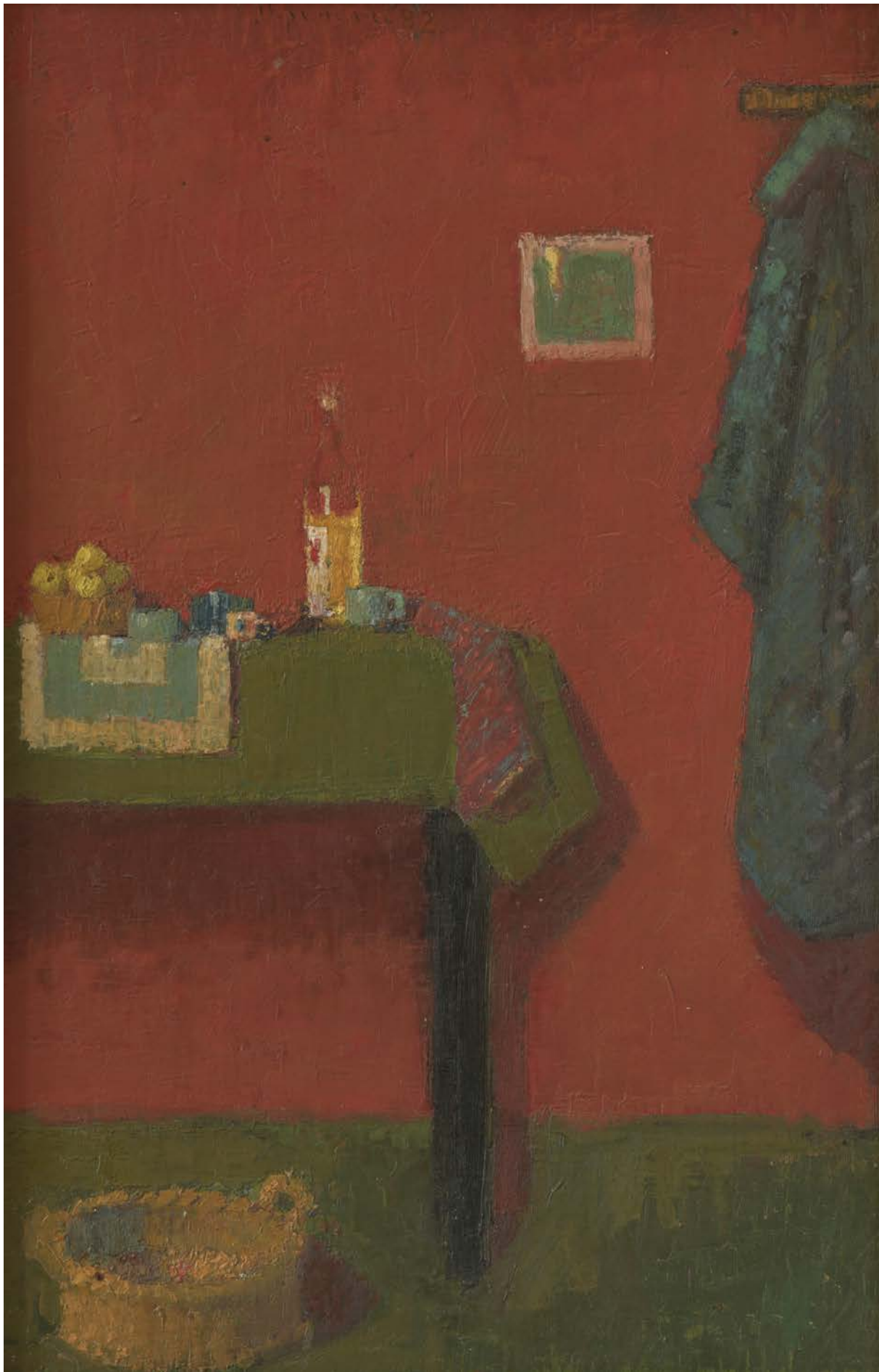
ЦРВЕНА СОБА , 1982, УЉЕ НА ПЛАТНУ КАШИРАНО НА ЛЕСОНИТ, 59×39, КОЛЕКЦИЈА МИЛОЉУБА И ИВАНА ПЕРИЋА