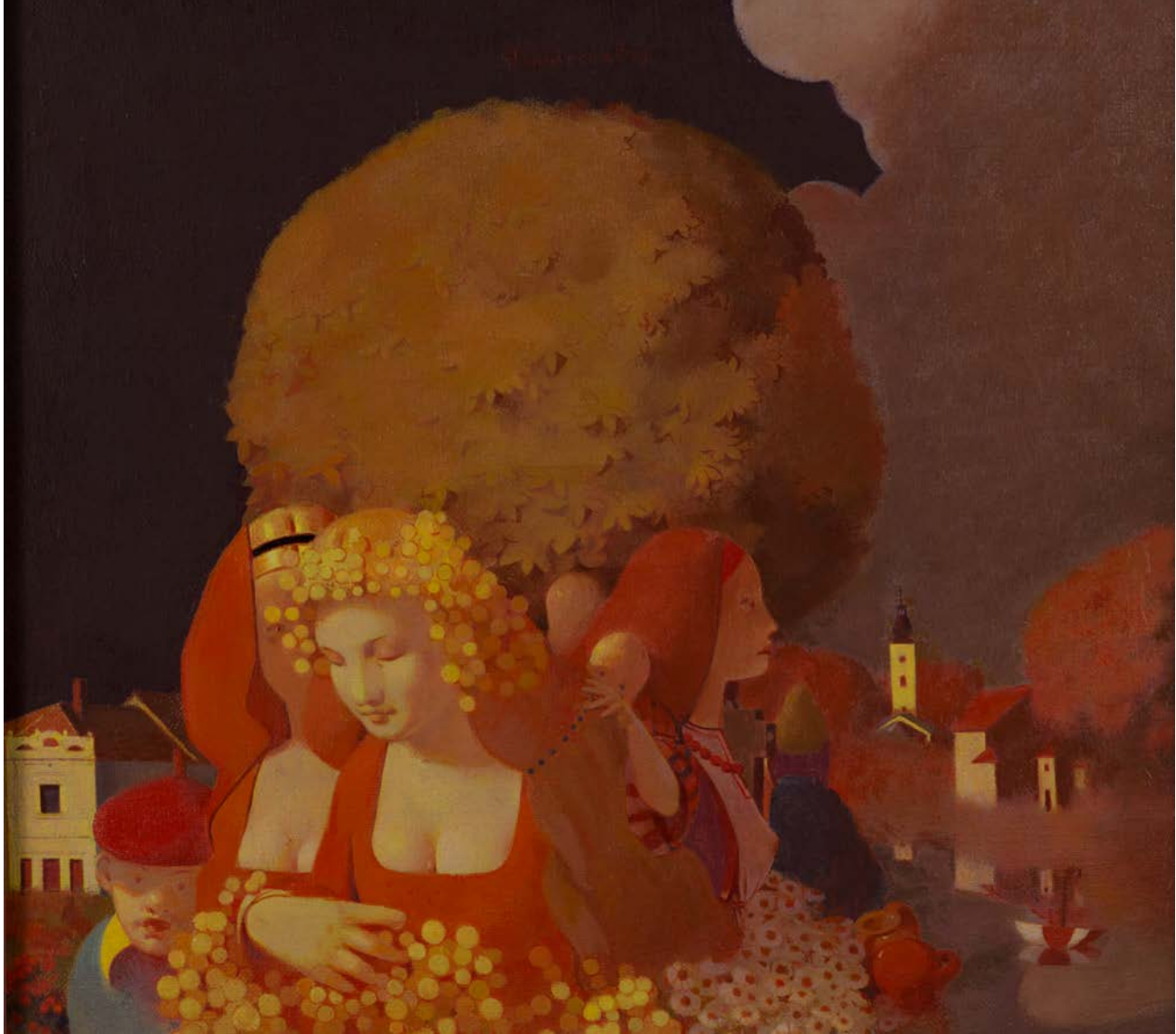
КЊАЖЕВАЦ , 1999, УЉЕ НА ПЛАТНУ, 28×31, ВЛАСНИШТВО АУТОРА