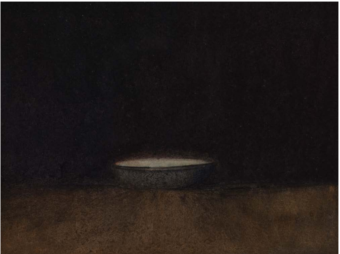
МРТВА ПРИРОДА I , 1986, АКВАРЕЛ 17×24, ВЛАСНИШТВО АУТОРА