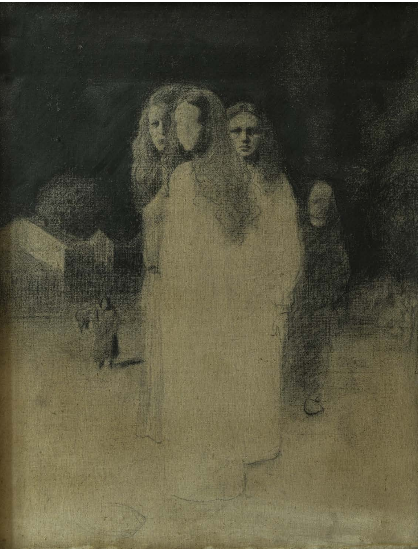
БЕЗ НАЗИВА , 1986, ЦРТЕЖ УГЉЕНОМ НА ПЛАТНУ 108×104, КОЛЕКЦИЈА МИЛОЉУБА И ИВАНА ПЕРИЋА