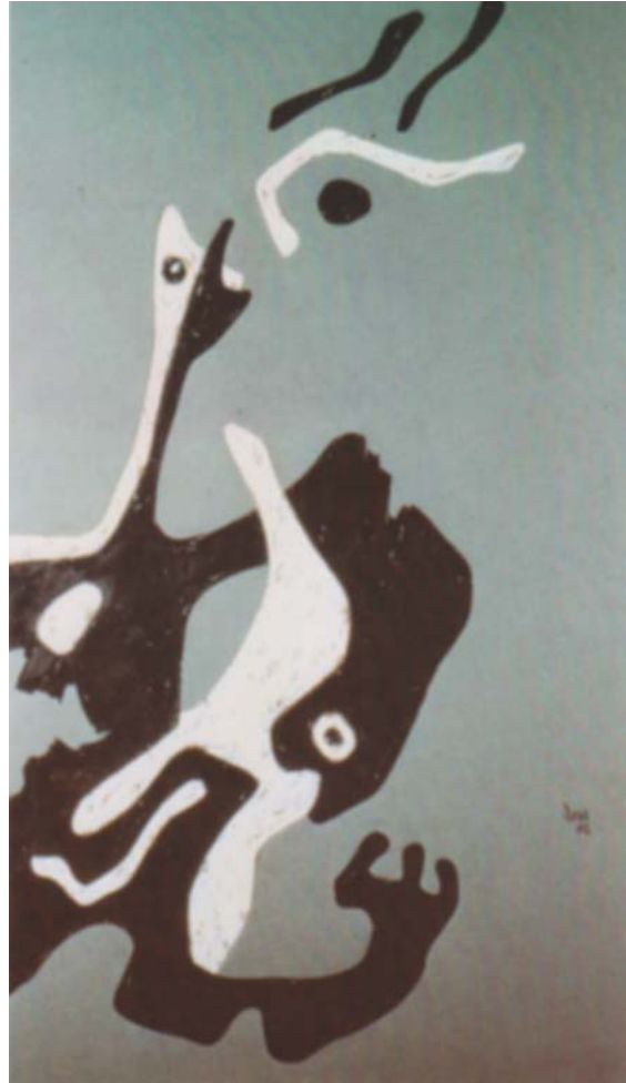
Сава Ракочевић, Порицање раја , 1990.