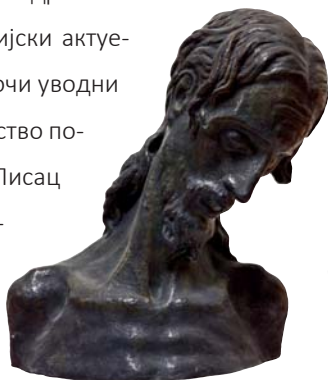
Тома Росандић, Глава Христџа , 1915.

Збирка одабраних есеја историчара уметности Николе Кусовца на први поглед оставља утисак садржински монолитног рада врсног познаваоца савременог српског ликовног стваралаштва посматраног у ширем рецептивном оквиру, од краја XIX века, па до данас. Али, читалац ће се брзо уверити да Кусовчева рефлексија уметности поменутог временског сегмента није садржински редуцирана једино на његов историјски актуелан аспект. О томе најречитије сведочи уводни есеј са поднасловом „Српско сликарство после 1690, између иконе и слике“. Писац ове књиге убедљиво показује да догађања у српској ликовној уметности нашег времена не би била разумљива без осврта на њихове