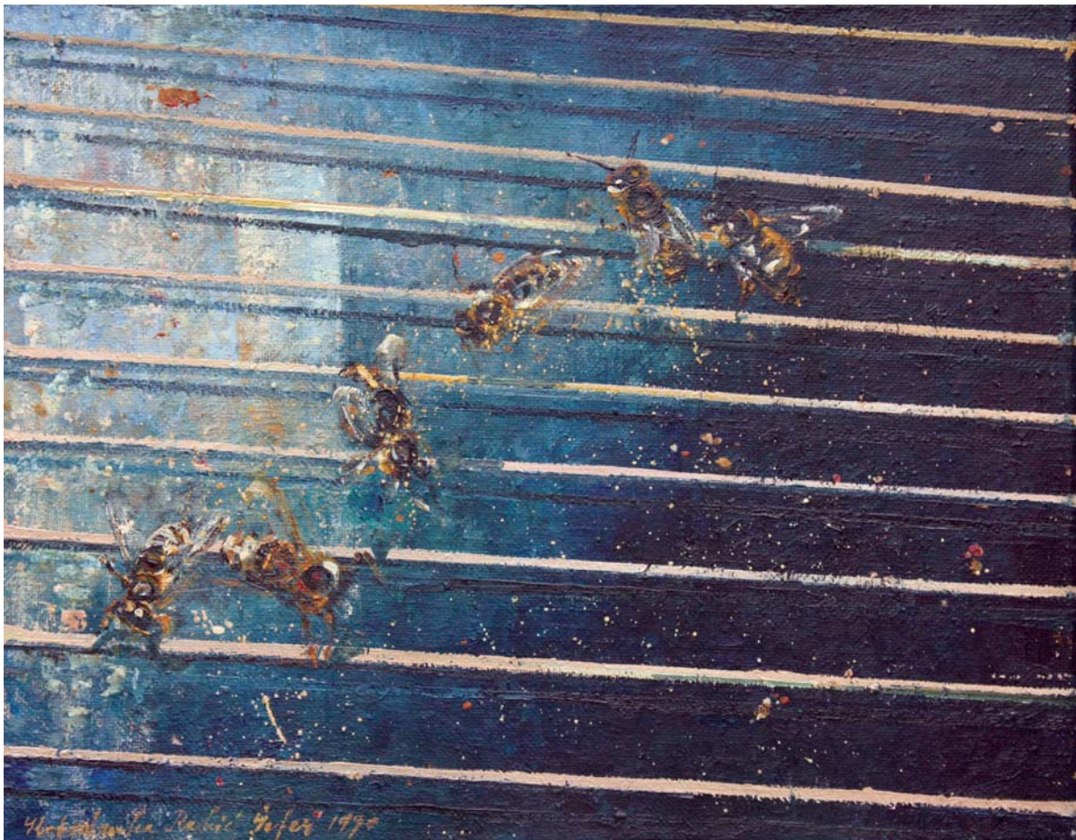
Слободанка Ракић Шефер, Мали концерн у њредвечерје , 1990.