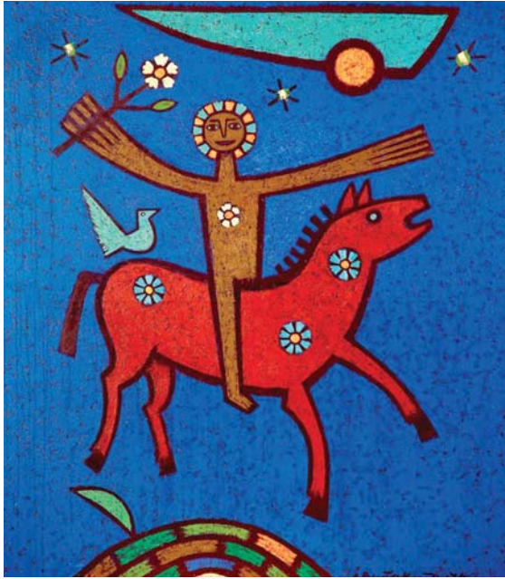
Лазар Вујаклија, Мира Весник , 1974.