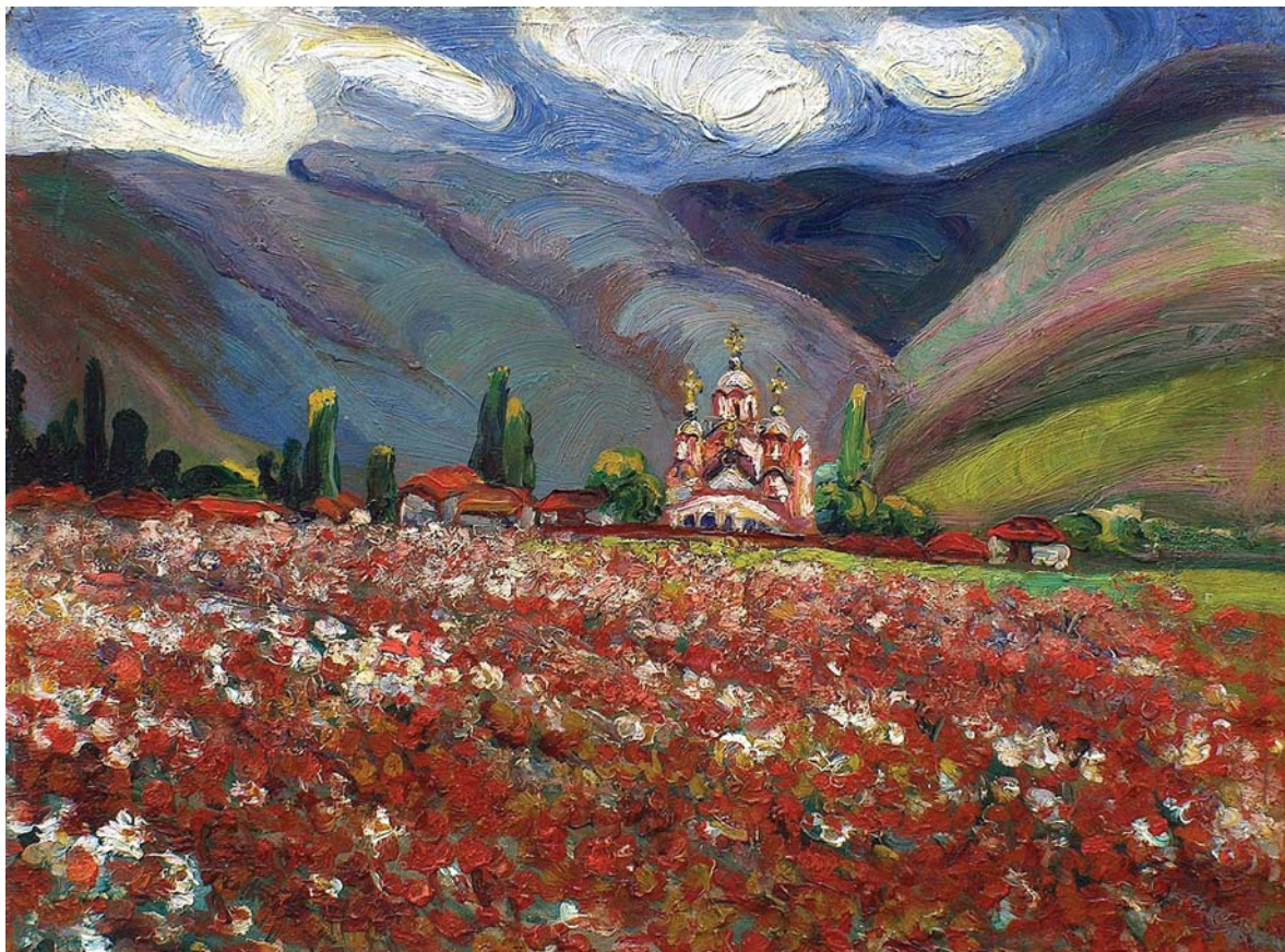
Надежда Петровић, Косовски божури – Грачаница , 1913.