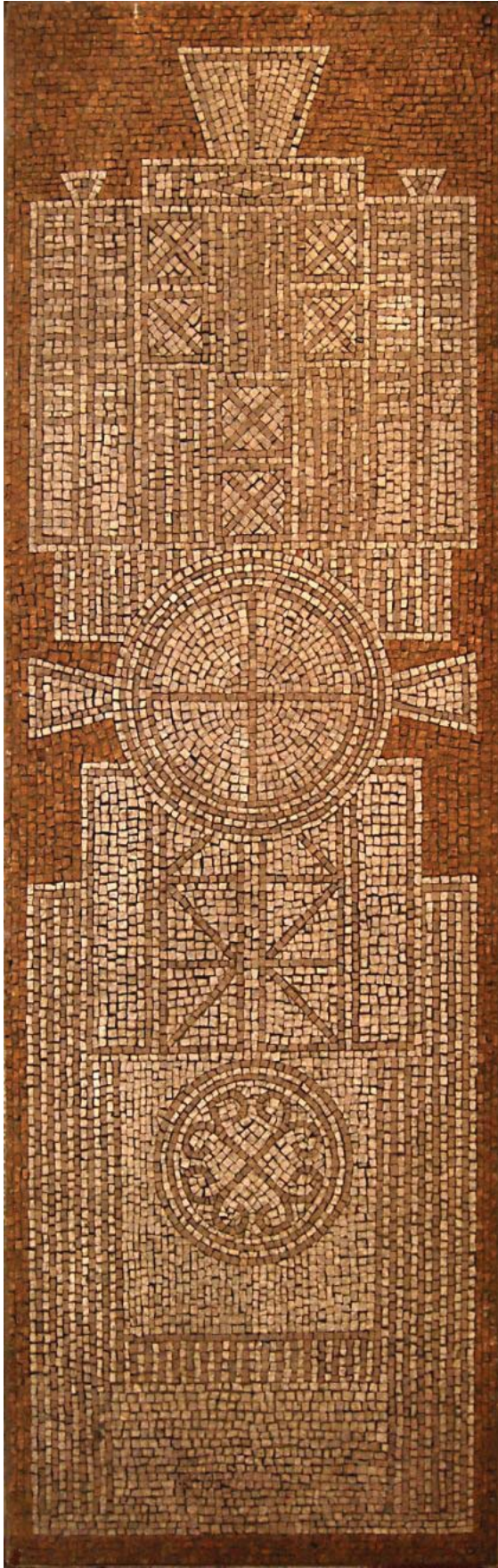
Александар Томашевић, Сїела , 1965.