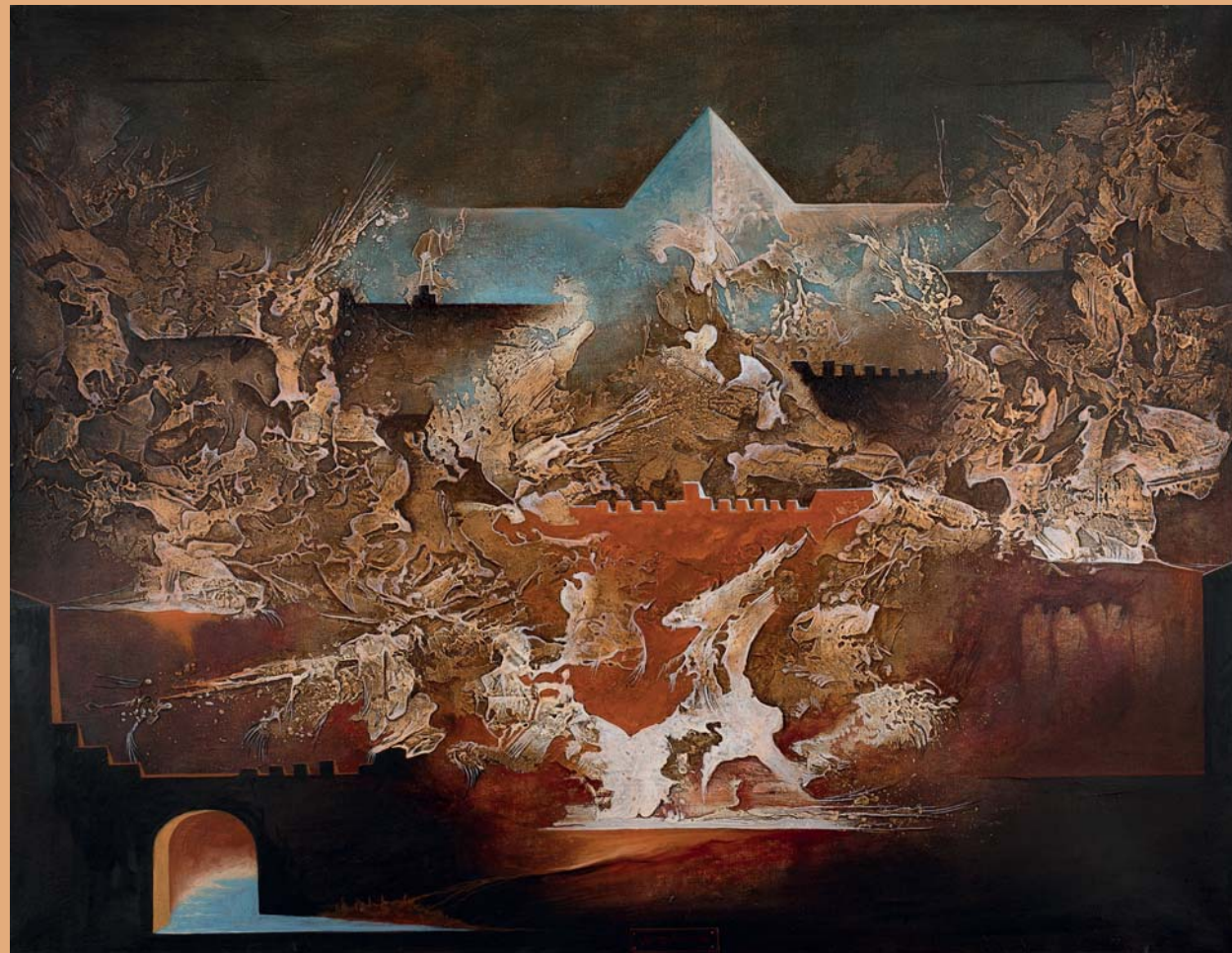
OPUS 2018, LE PRISME CRUCIFIÉ, 2012.