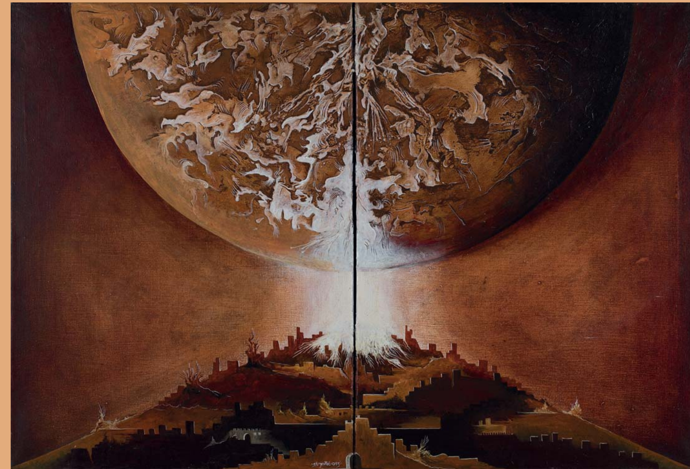
OPUS 2019, SODOM GOMORE, COLÈRE DE DIEU, 2012.