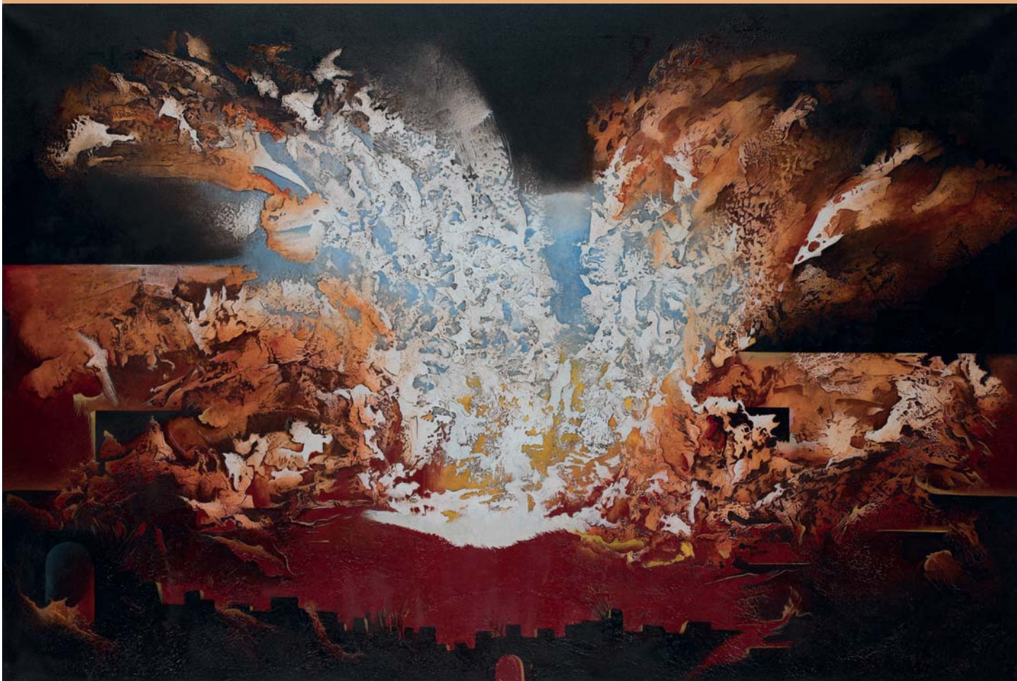
OPUS 1370, HOMMAGE A VICTOR HUGO, 2004.