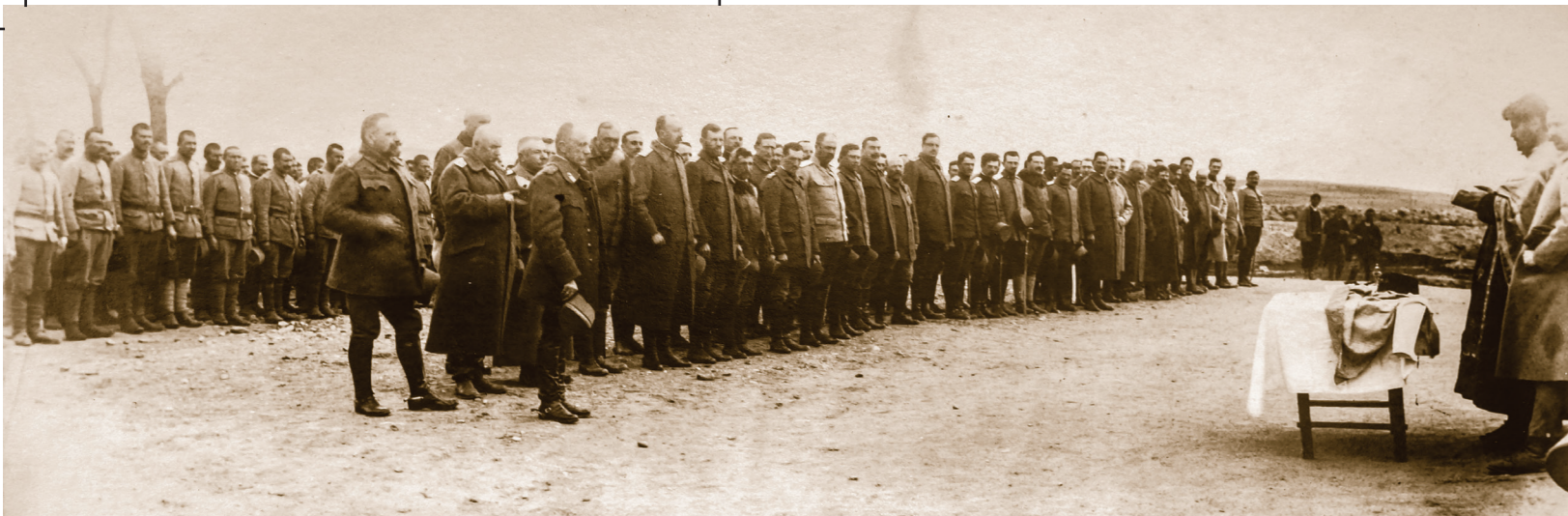
Богојављенско освећивање водице 1917, Доња Врбена (Народни музеј Краљево, Албум "Успомене из ратовања, Куманово, Битољ, Брегалница, Црна Река, Ниш")

су добили нову одећу и веш у довољним количинама.