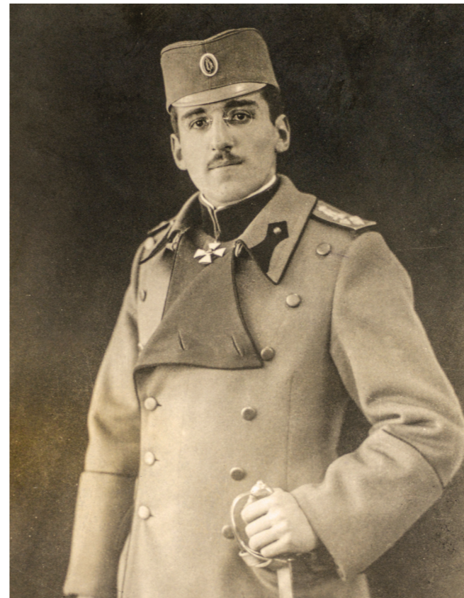
Регент Александар Карађорђевић, врховни командант српске војске у Првом светском рату (1914-1918)

Око поноћи, 2/15. на 3/16. август 1914. године, по страшном пљуску, дошло је до изненадног сусрета две војске у покрету код села Текериш, чиме је почела Церска битка. Српски војници (Први и Други прекобројни пук Моравске дивизије, који су били у саставу Комбиноване дивизије) били су у тој бици много одлучнији. Образована је Церска ударна група, састављена од Моравске и Ком-