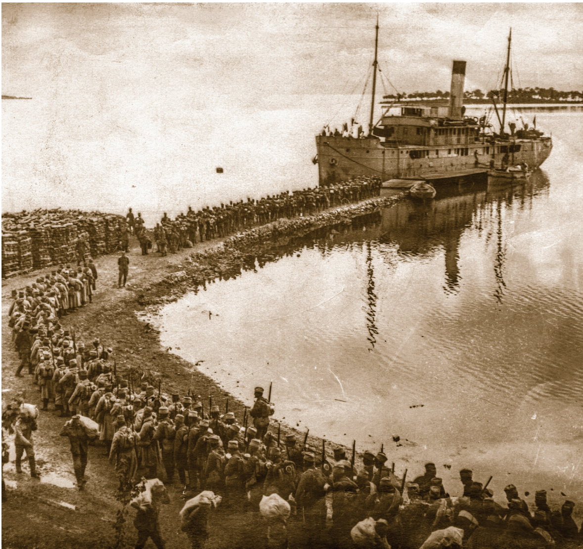
(Укрцавање војника XVI пешадијског пука Моравске дивизије на пристаниште Говино, Крф, крајем априла 1916. Архив Србије, ПО 101-249)