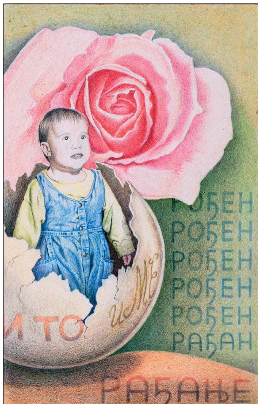
СТРАНИЦА ИЗ КЊИГЕ ТО СИ ТИ, 1992.

Уобличени стих, глосолалије, калиграмима, поетике раних авангарди и оне које настају у другој половини 20. века – конкретна, визуелна, спацијална, семиотичка и друге – представљали су посебне приступе који нису имали заједнички појам и име, а сврставани су или у минорну поезију или у словни дизајн или „између поезије и сликарства“. Стога сам ту област у цело-