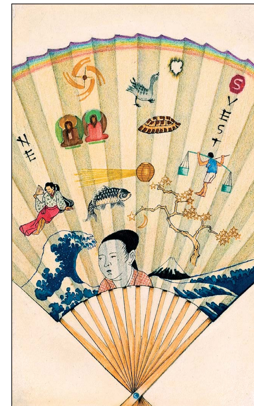
СТРАНИЦА ИЗ КЊИГЕ МЕНА, 1991–1992.

1973), које се могу уредити у секвенце ( Пустолина , трећи део, 1956–1962). Типови знакова често прелазе једни у друге. Музикализација влада као у звучној поезији, али без губитка семантичности. Посебна поетика не искључује поетичност појединог остварења, али она није поезија. У сврху проширења могућности примењују се филм, видео, компјутерска анимација и