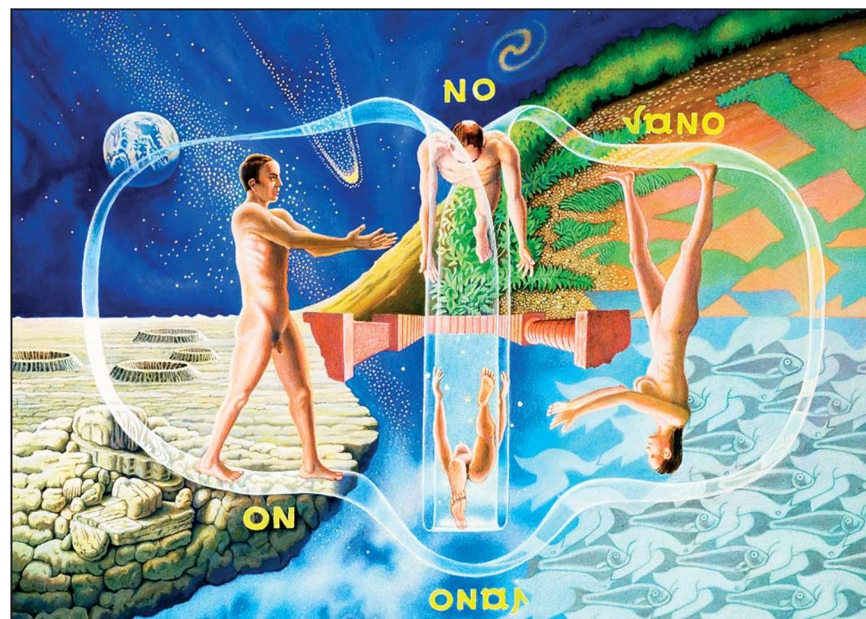
ВОКОВИЗУЕЛНИ ОМАНЖ ЕШЕРУ, 1998.

Моја специјална поетика воковизуела (1954) синтеза је битних својстава вокови-