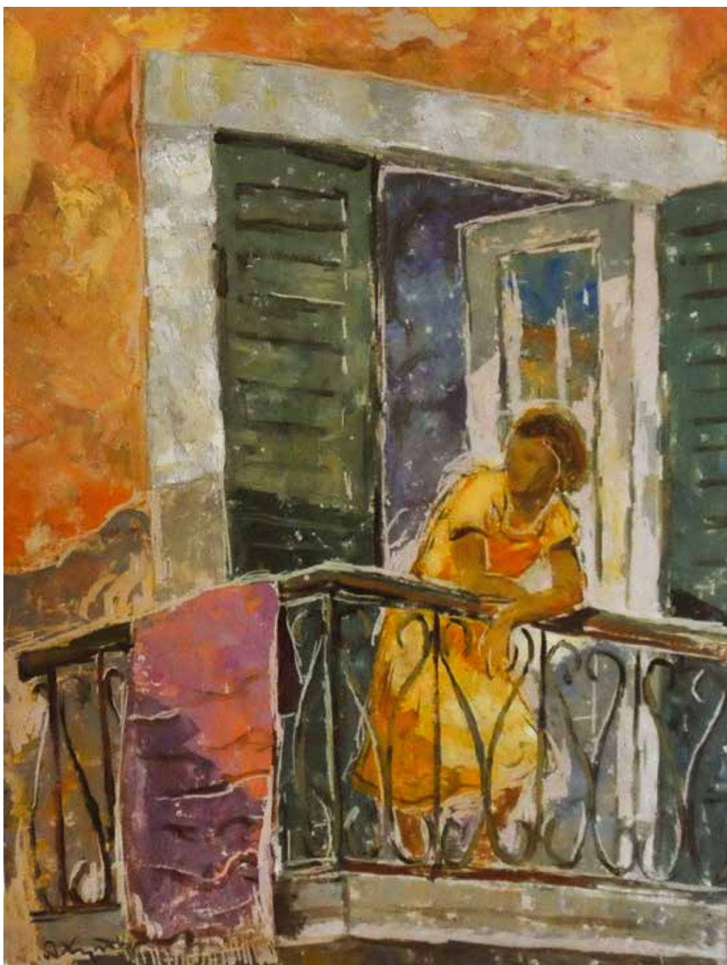
17 На балконе , око 1950.