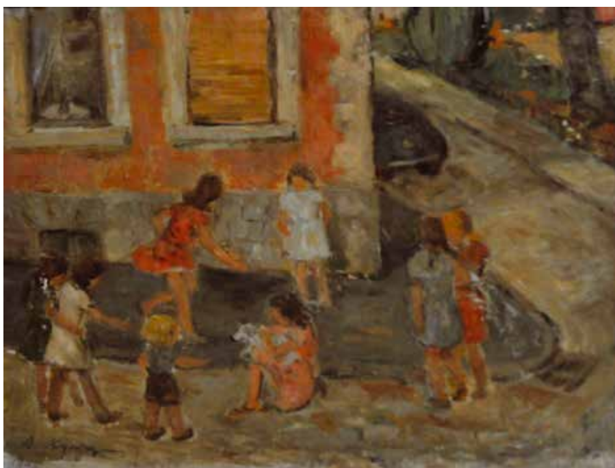
10 Деца , 1942.