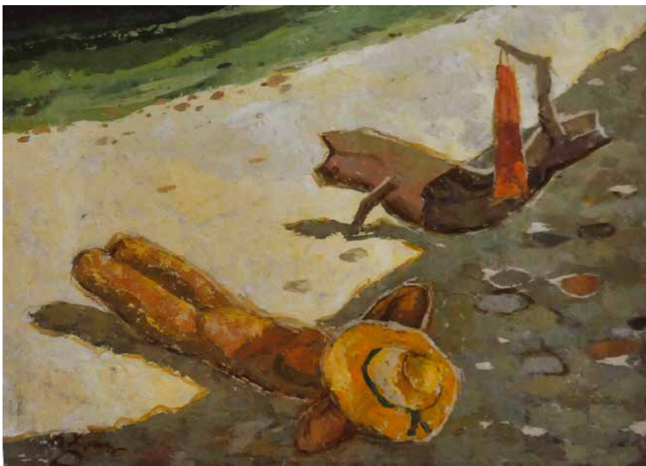
18 На йлажи , око 1950.