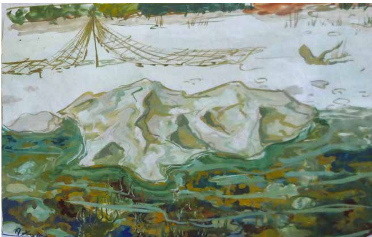
32 Сїена у мору , скица, око 1955.