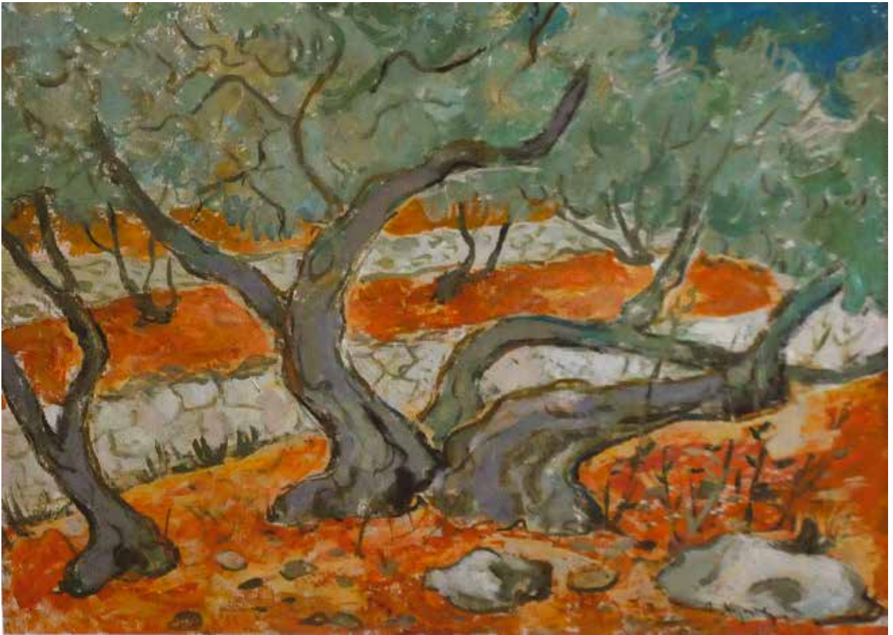
27 Маслине , 1952-1955.