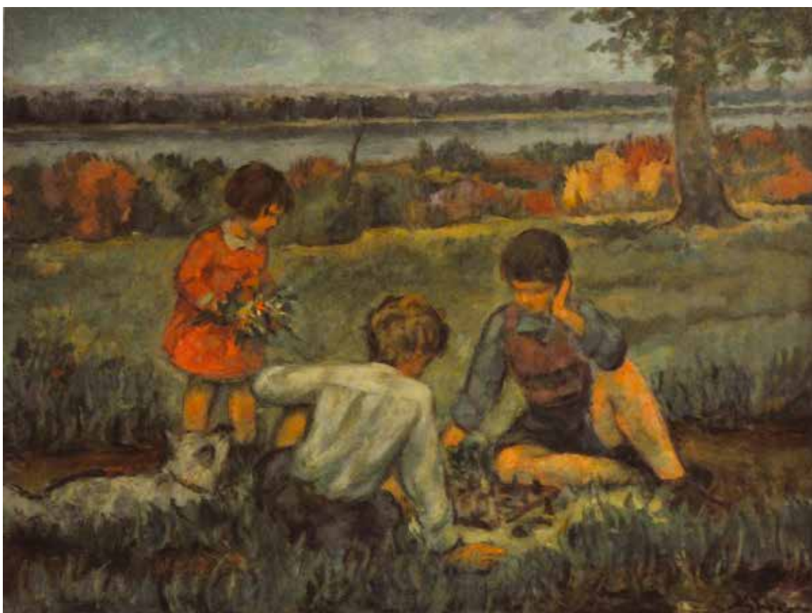
25 Шах у Илоку , 1952-1953.