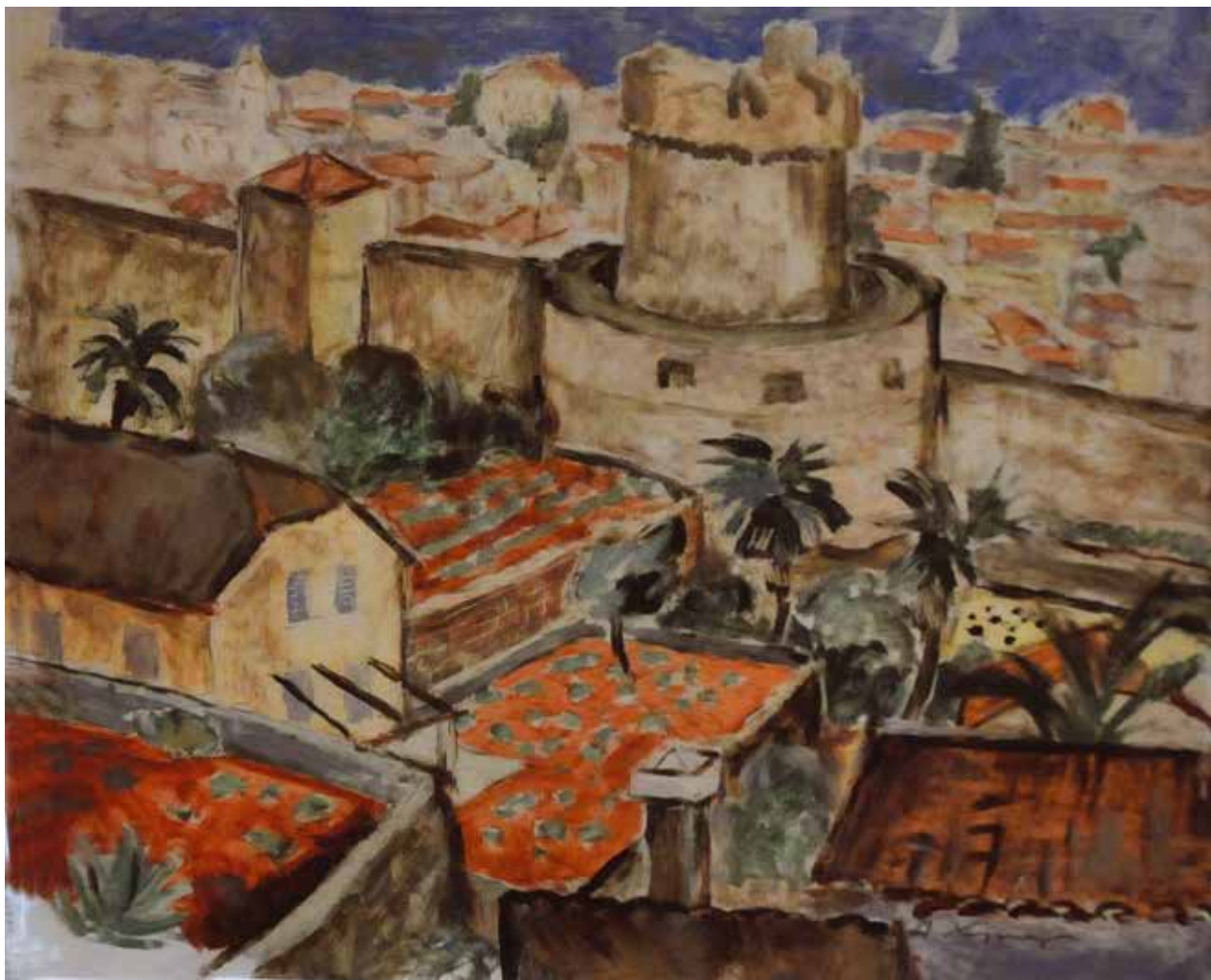
6 Дубровник , око 1939.

за светлост „које му никада није било довољно“ (Павле Васић). Такође, Хутер је знао да наслика воду на такав начин да га је Зуко Џумхур, гледајући његове приморске пејзаже на којима се виде питоме обале и прозачни плићаци који се огледају у сенци мирисних борова, назвао правим сликарским чаробњаком.