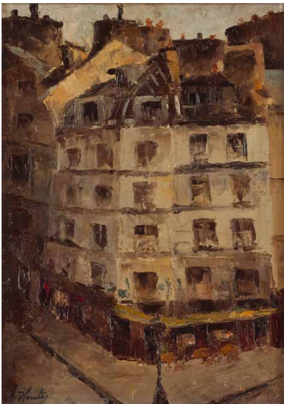
1 Улица у Паризу , 1928.