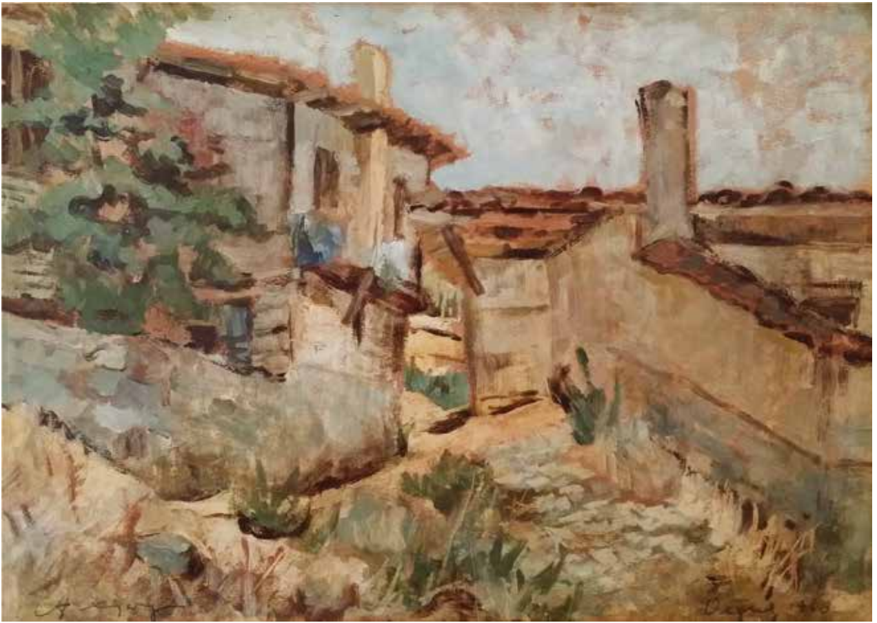
7 Мой дом из Охрыга, 1940.