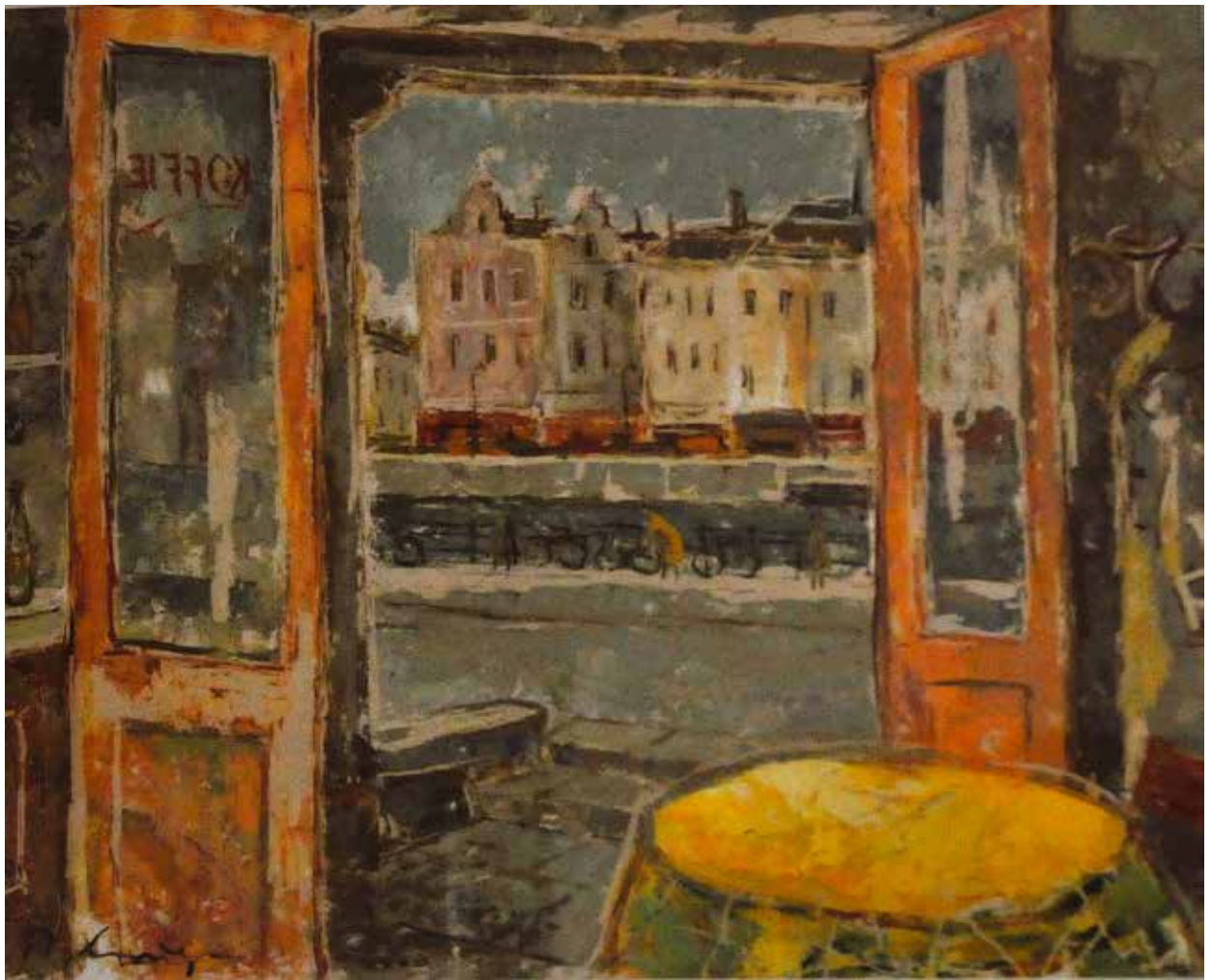
29 Кафе у Амстердаму , 1952-1955.