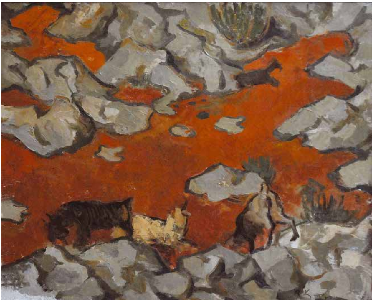
31 Предео са козама , око 1955.