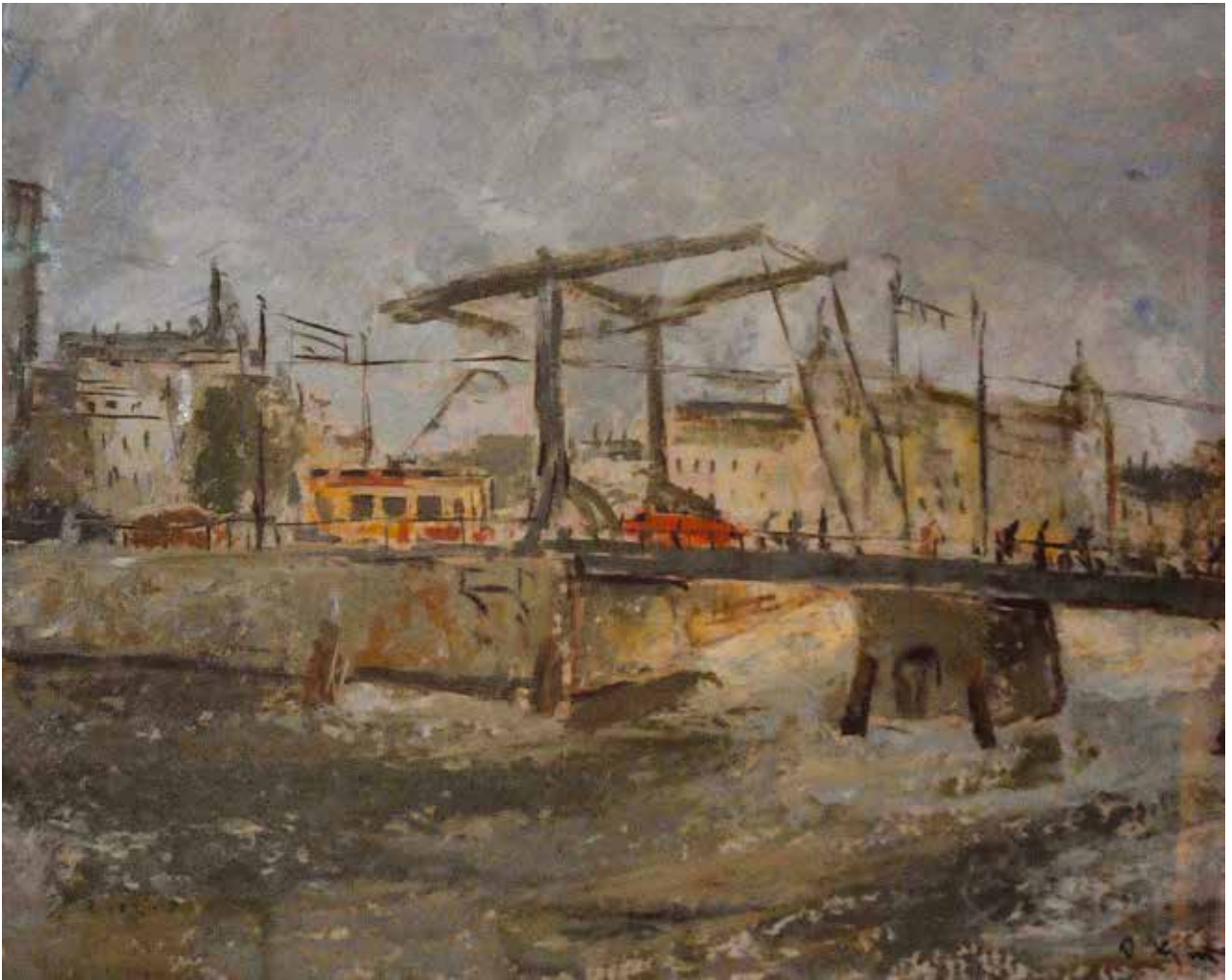
28 Мосї у Амсїердаму, 1952-1955.