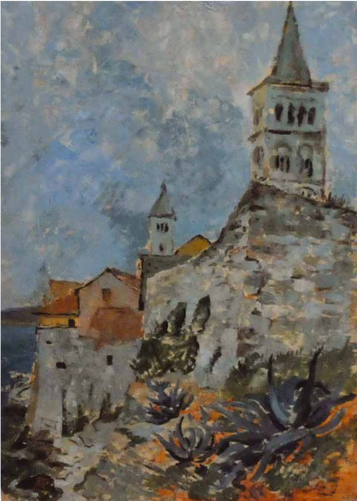
15 Раб , 1948.