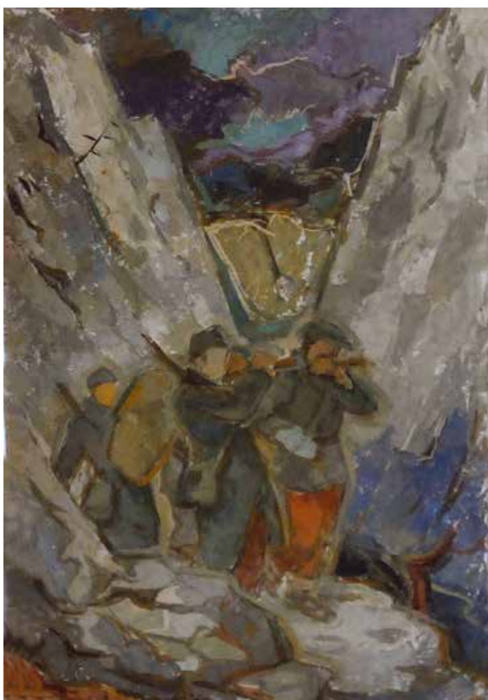
12 Прелаз преко Нерешве , 1947.