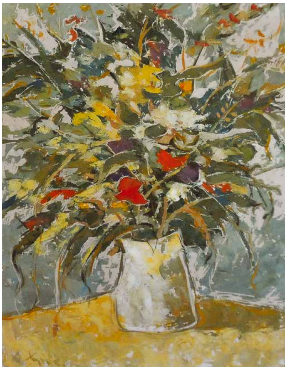
16 Пољско цвеће , око 1950.