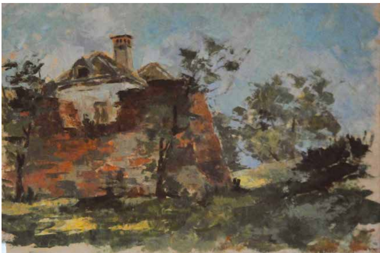
26 Моїив из Илока , око 1952.