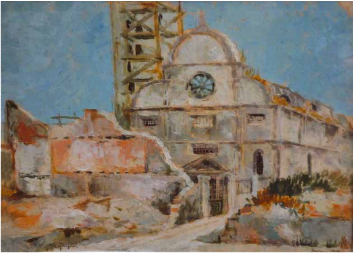
19 Свешти Донаш у Загру, 1950.