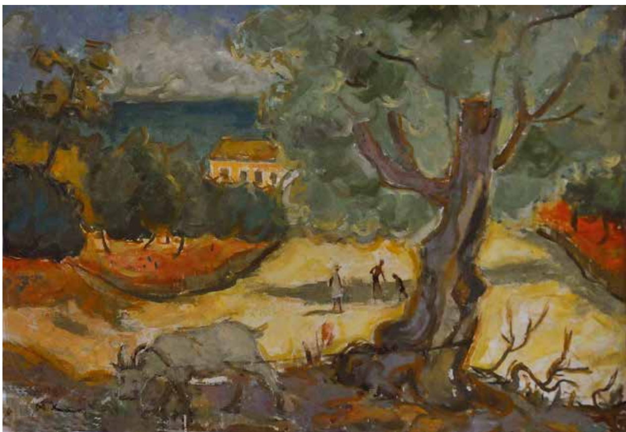
21 Брела - пејзаж из Макарске , после 1950.