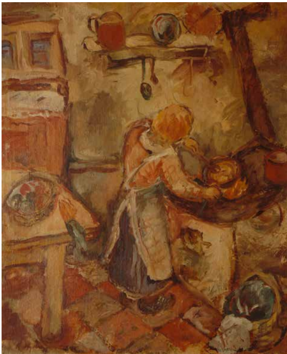
5 У кухињи , 1937-1939.

свакодневни живот. Тако ће пронаћи заједнички именитељ са другим сликарима из београдског друштва „Живот“ и непосредно га укључити у познату „бојкоташку“ изложбу, одржану 1936. на Техничком факултету у Београду.