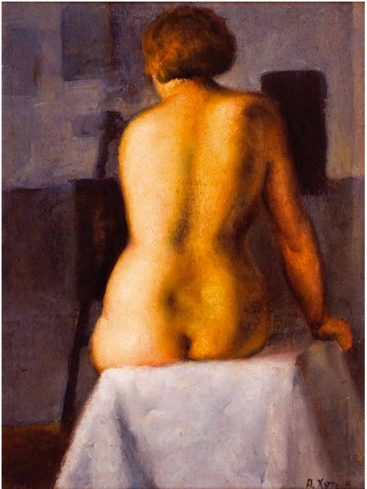
2 Сегећи акѝ слеђа , 1928.