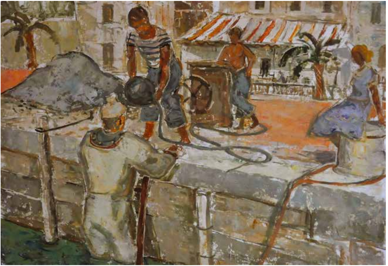
13 Обнова сїлійске луке , око 1947.