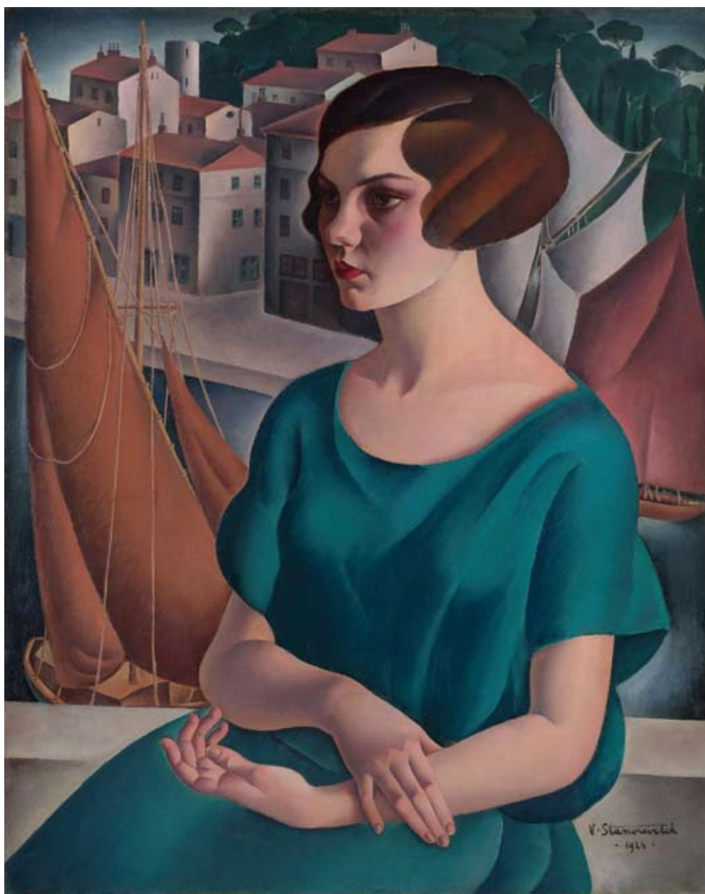
18 Портрет жене у зеленом, 1924.