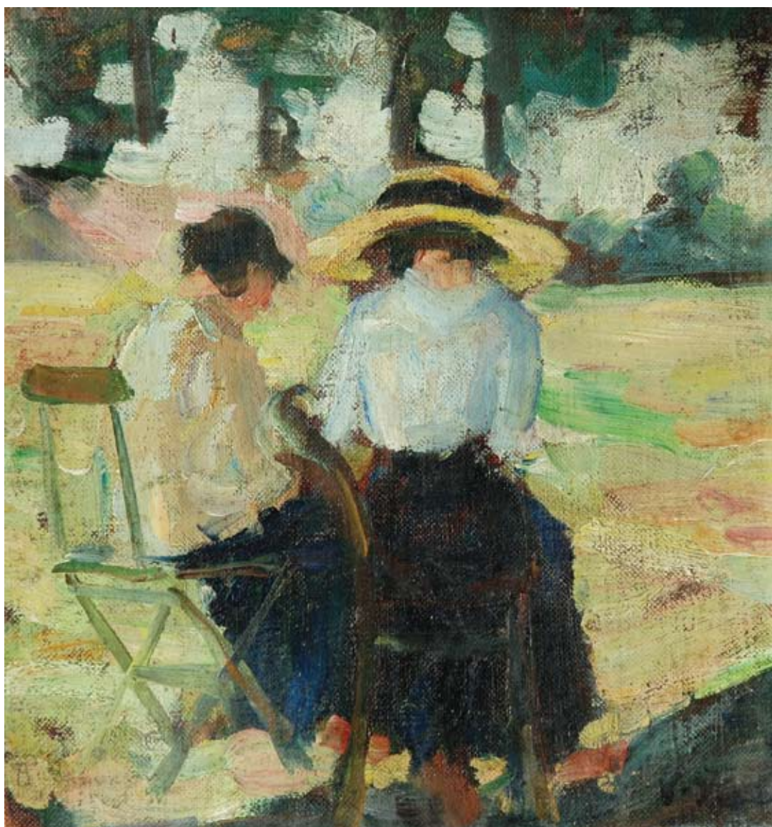
2 Код шестī шайола, 1945. (антидатирано)