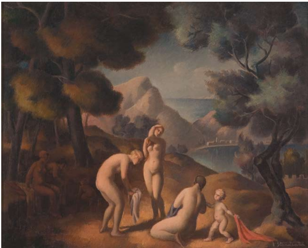
16 После куйања, 1923.

ство контраста чине Станојевића уистину савременим модерним уметником и једним од најбољих које смо икада имали“.