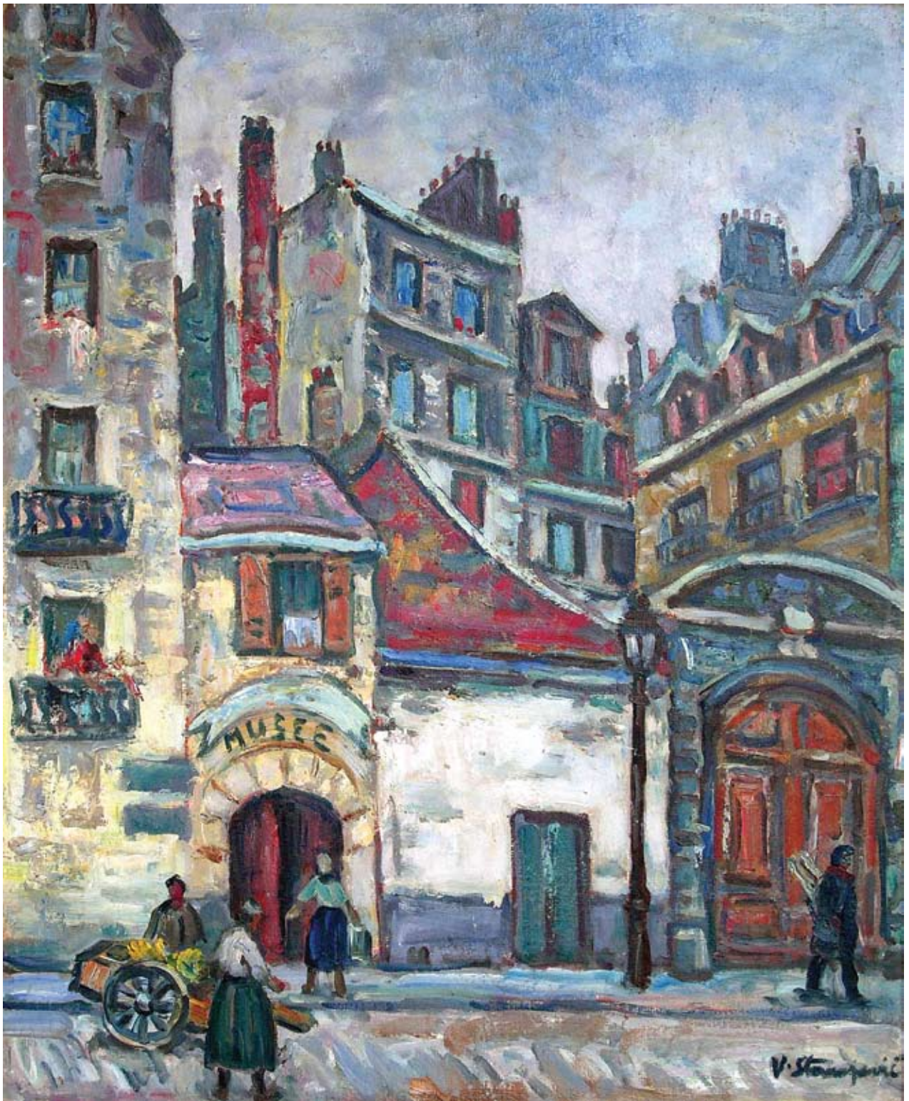
26 Музеј у Паризу