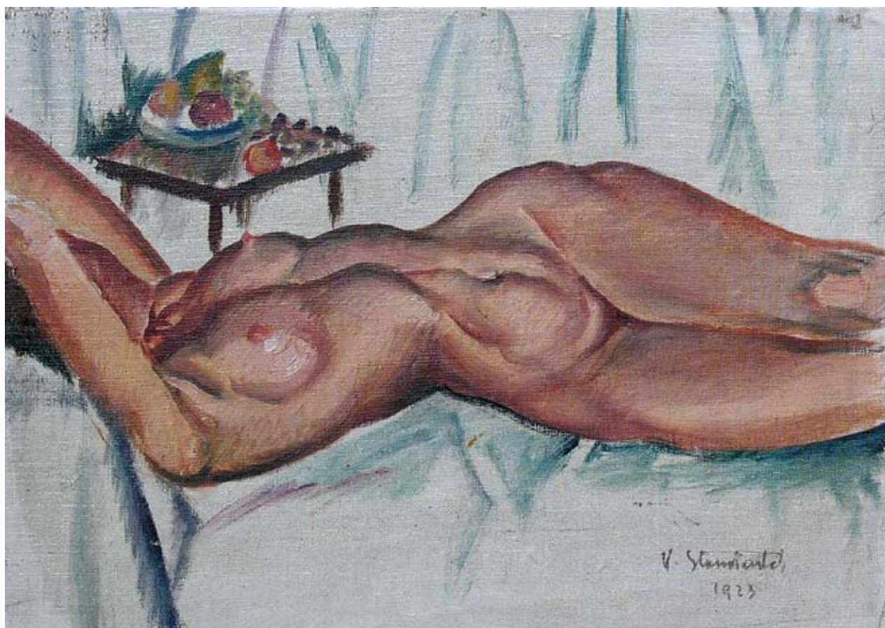
17 Лежећи акци, 1923.

једну празнину у морфолошком систему постојеће уметничке укупности, а да при том сачува печат свог порекла и традиције.