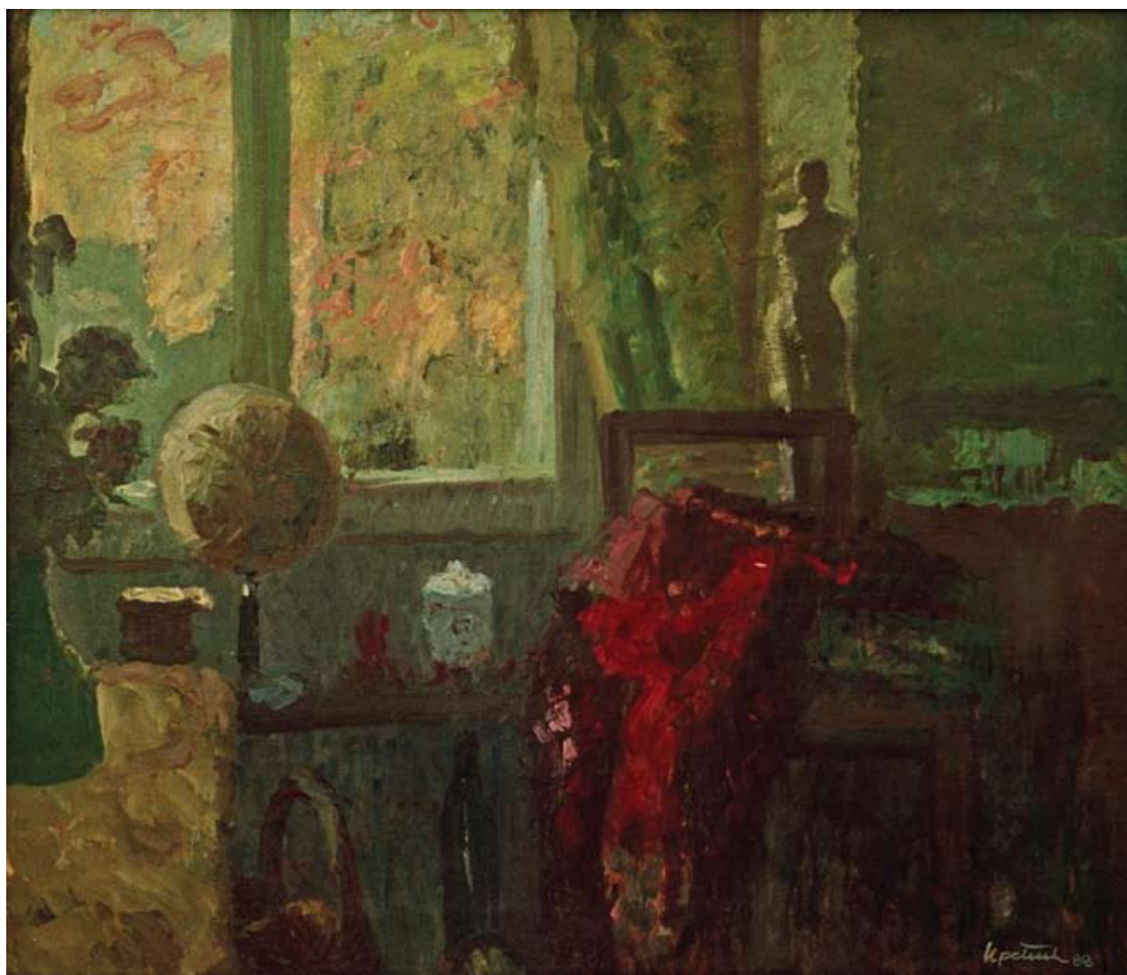
33 Светлости и сенке, 1988.