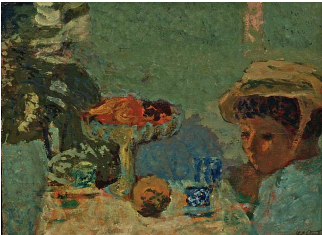
3 Девојчица и воће, 1969.