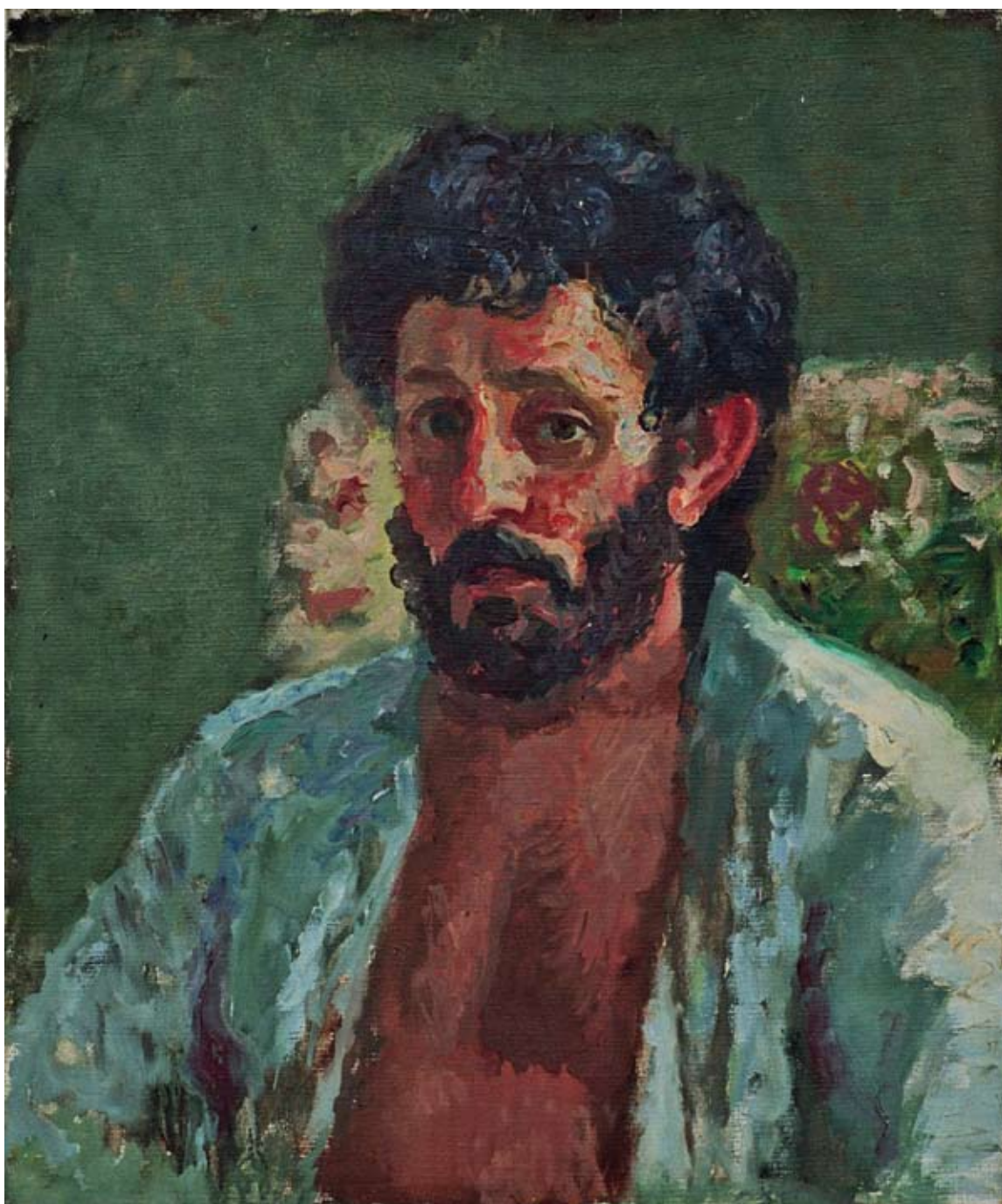
32 Портрет вајара Сџујовској, 1987.

власт снага разума над силама разарања и деконструкције.