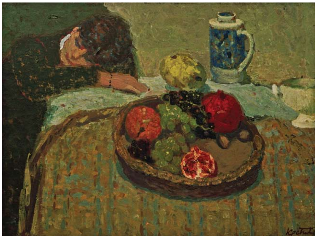
20 Девојка и воће, 1980.

као и уметност већине представника генерација после Другог светског рата, одражава потребу за континуитетом са најбољим представницима оне међуратне уметности која се ослањала на искуства француске школе. Истовремено, сликар је био и осетљив и пријемчив за успостављање релација са српском културном традицијом. На многим његовим радовима лако се препознају делови амбијента грађанске куће из Пирота.