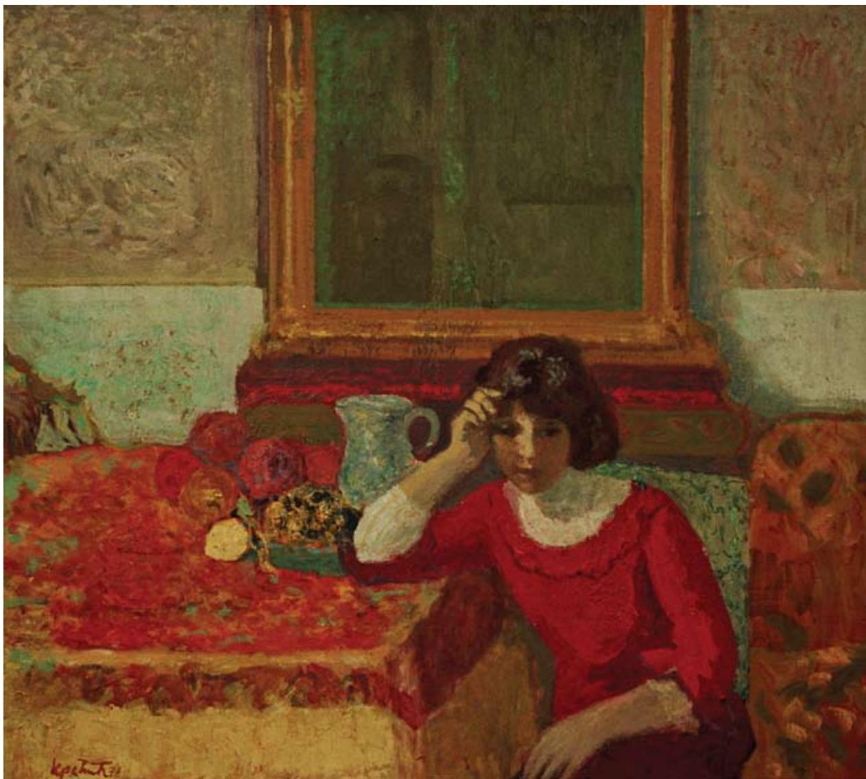
12 Фигура у хармонији ружичастих боја, 1977.

ватно због тога није дошло до неких изразитих промена.“