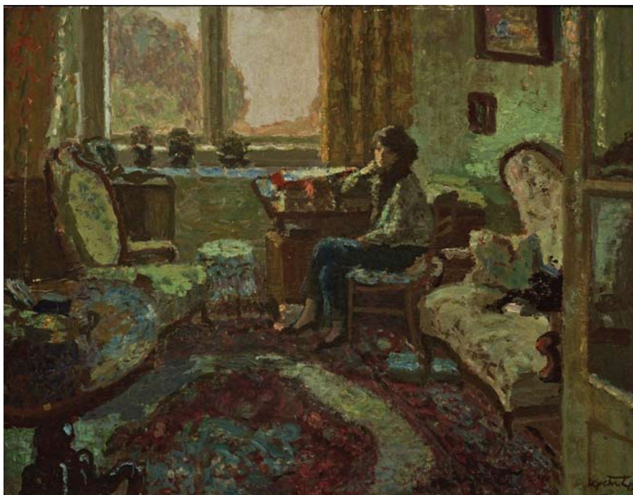
31 Еншеријер , 1987.