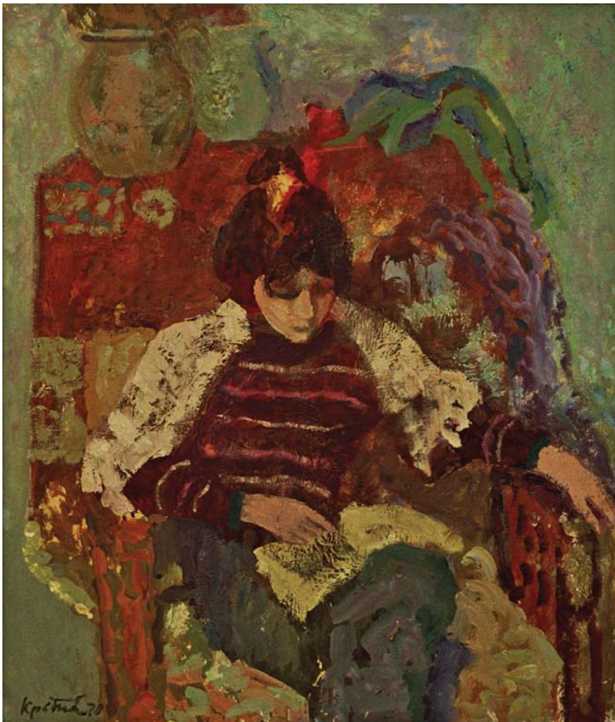
22 Жена са књијом, 1983.